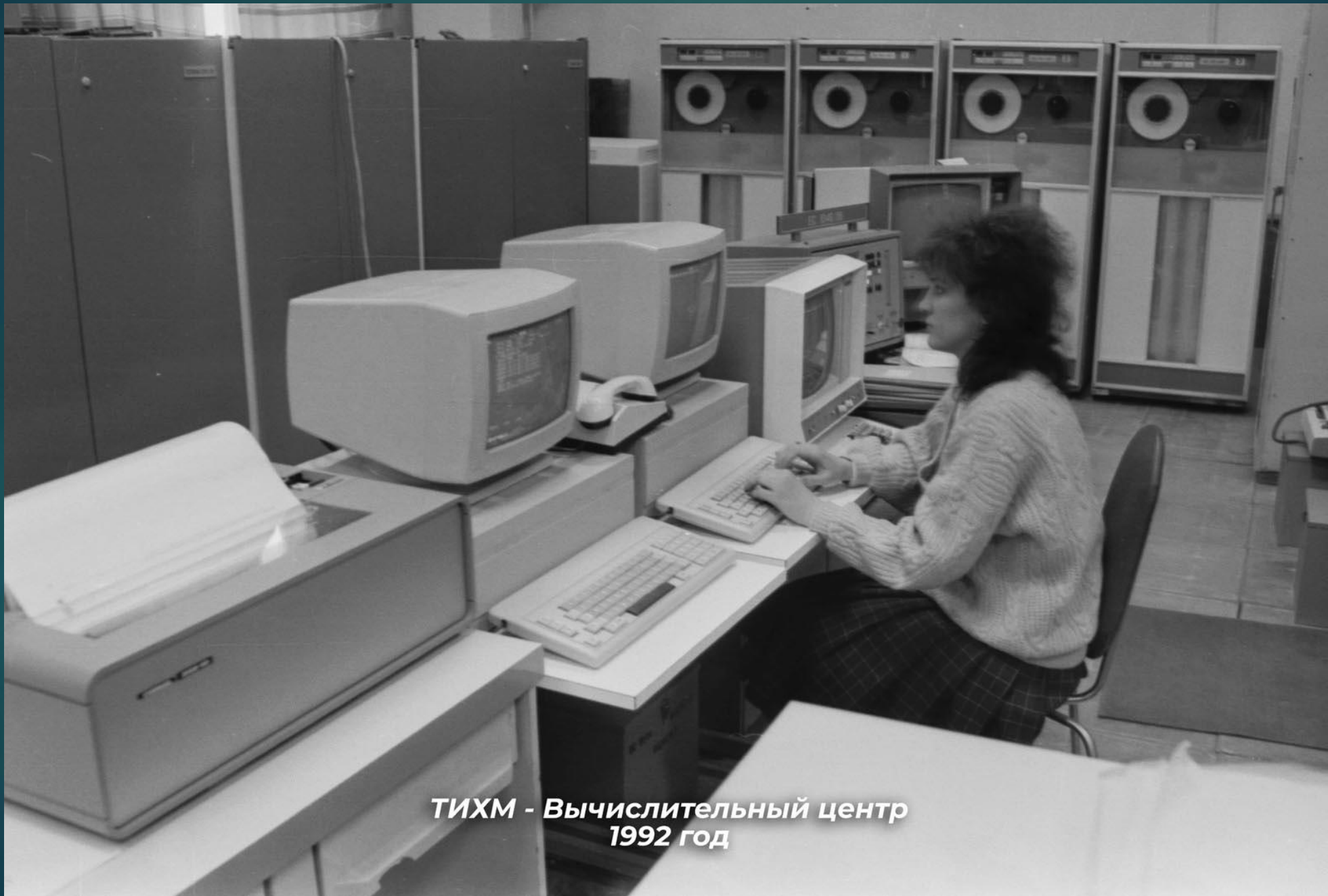
ТИХМ - Вычислительный центр 1992 год