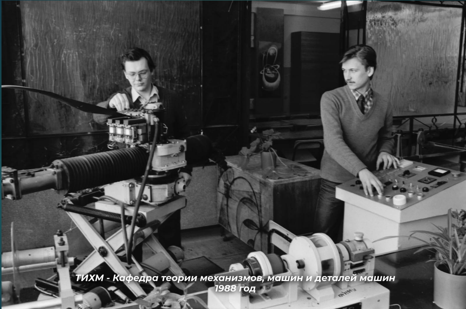
ТИХМ - Кафедра теории механизмов, машин и деталей машин 1988 год