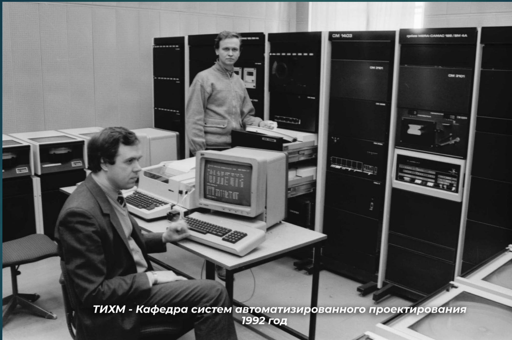
ТИХМ - Кафедра систем автоматизированного проектирования 1992 год