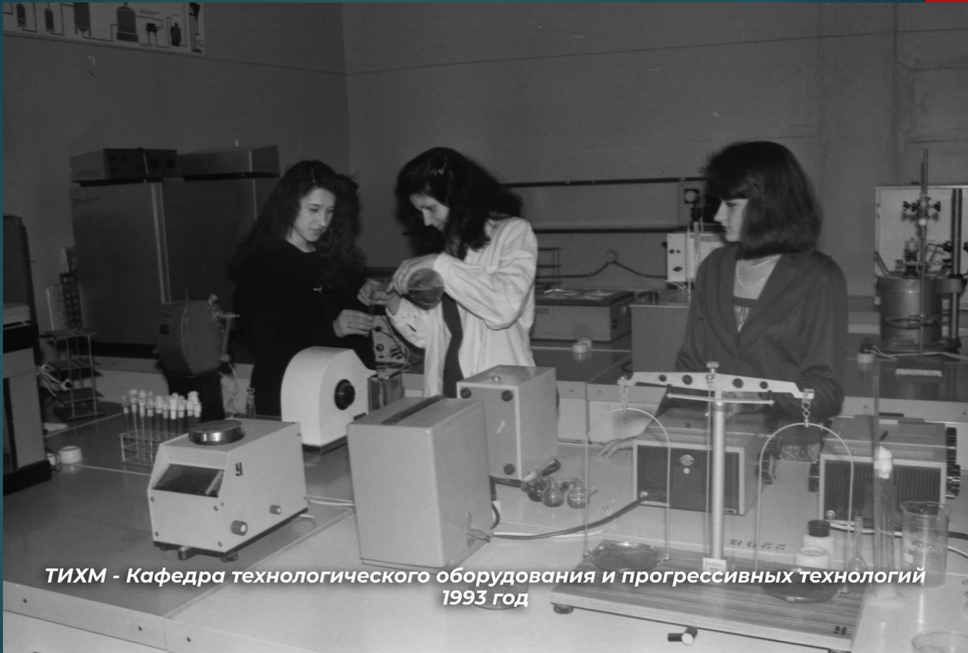
ТИХМ - Кафедра технологического оборудования и прогрессивных технологий 1993 год