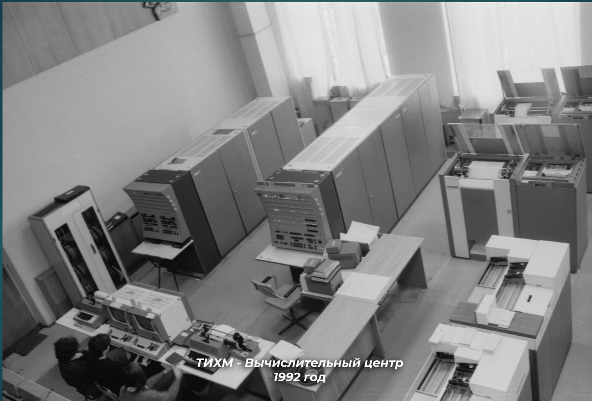
ТИХМ - Вычислительный центр 1992 год