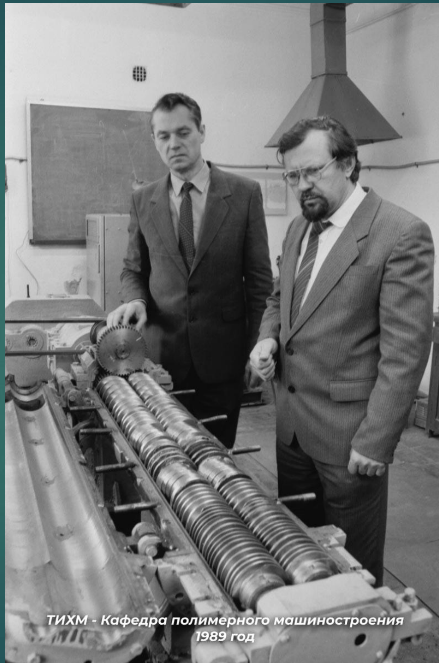
ТИХМ - Кафедра полимерного машиностроения 1989 год