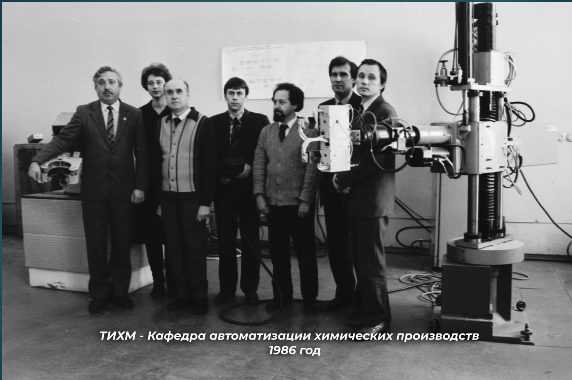
ТИХМ - Кафедра автоматизации химических производств 1986 год