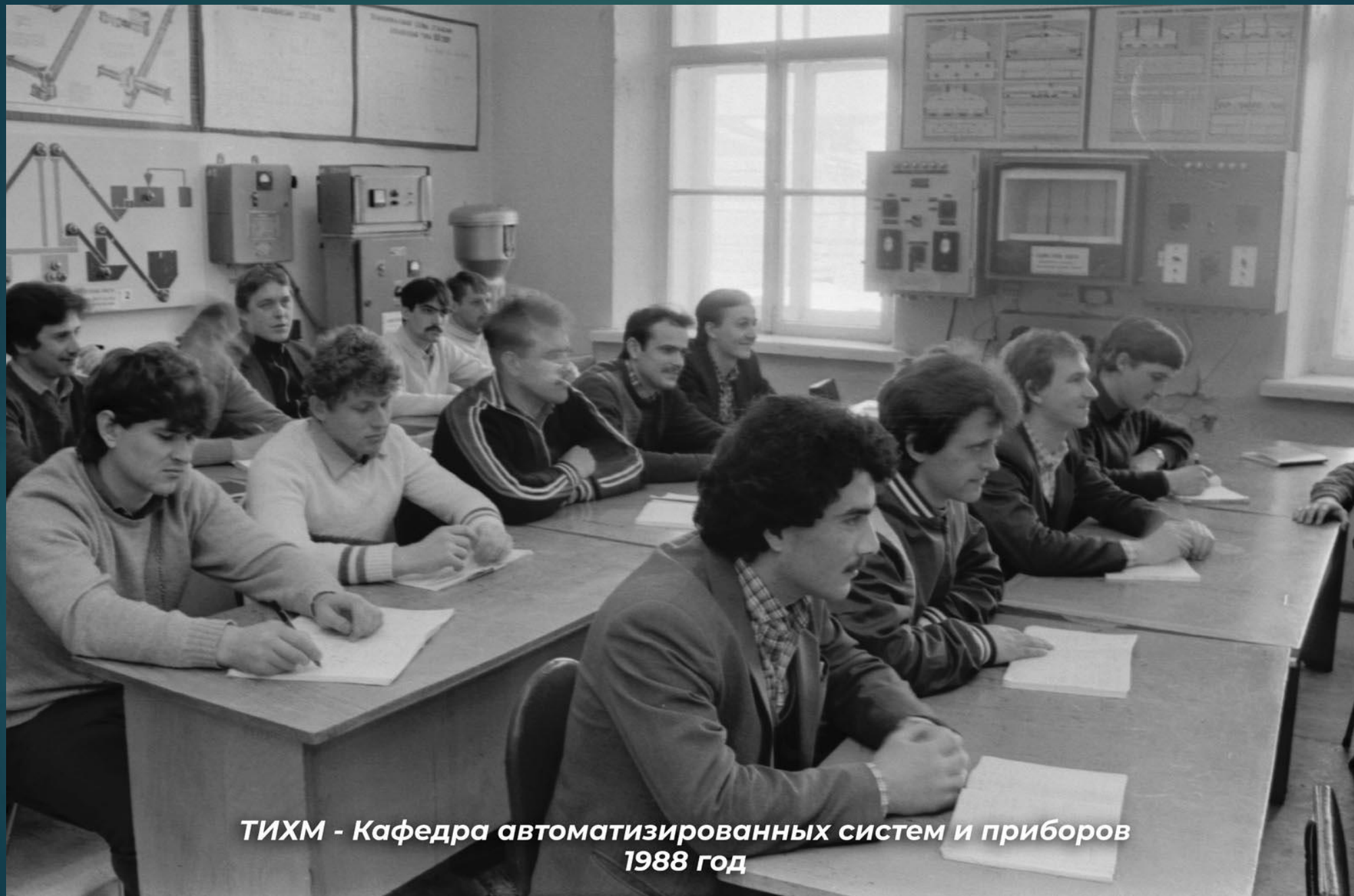
ТИХМ - Кафедра автоматизированных систем и приборов 1988 год