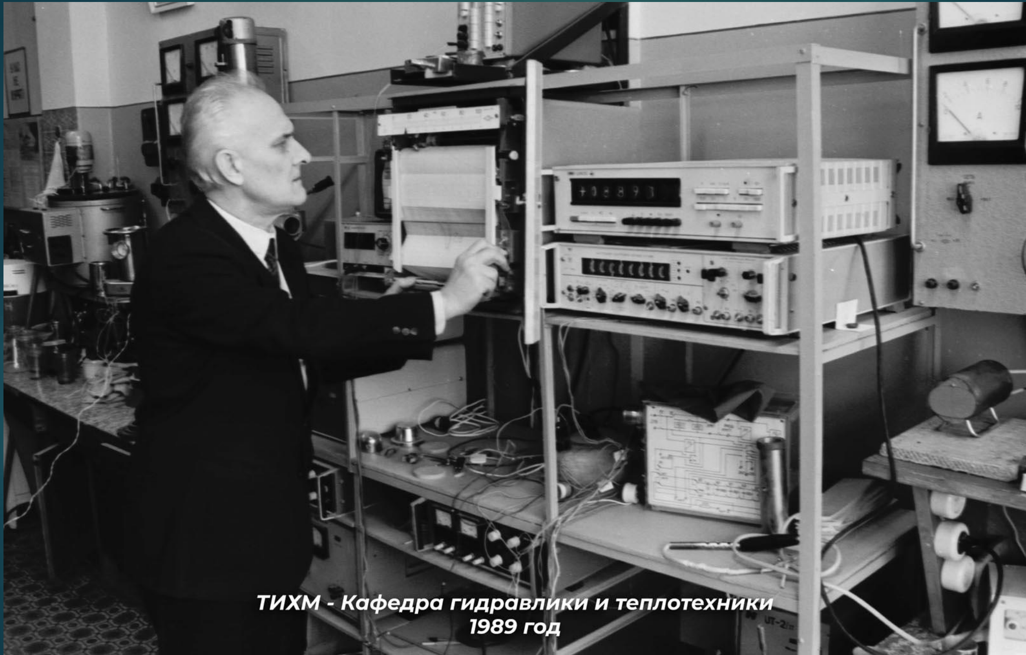
ТИХМ - Кафедра гидравлики и теплотехники 1989 год