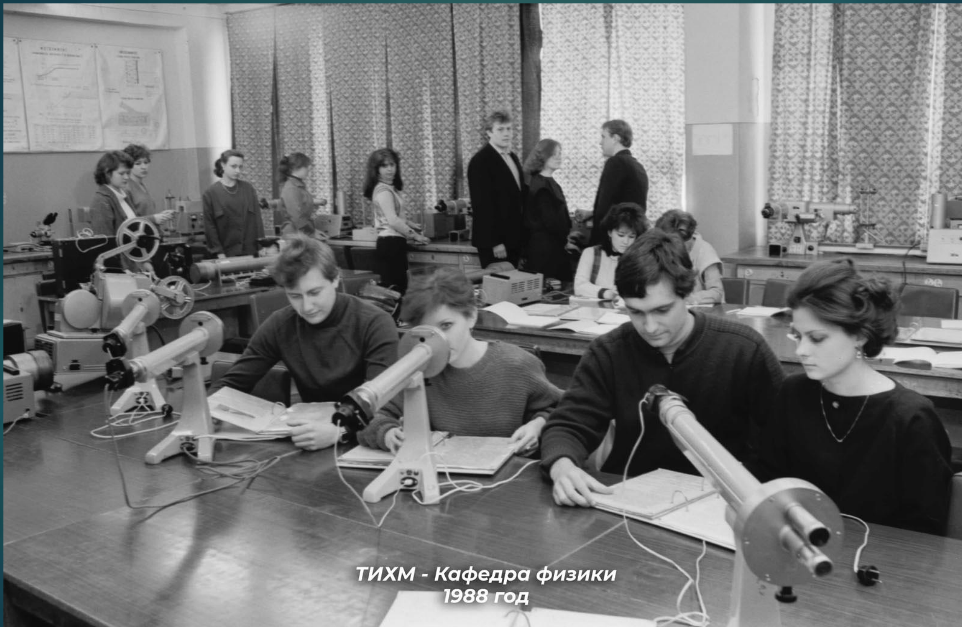
ТИХМ - Кафедра физики 1988 год