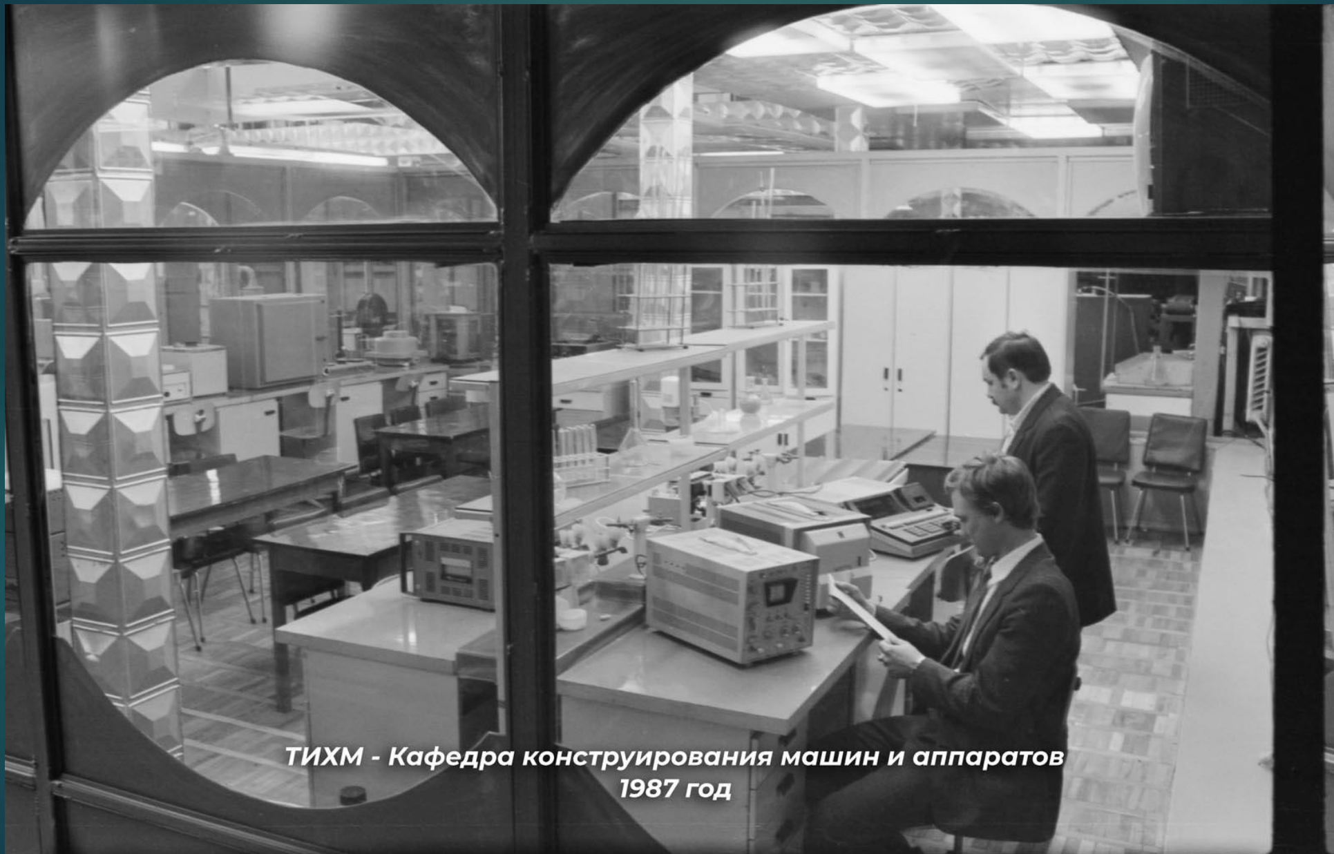
ТИХМ - Кафедра конструирования машин и аппаратов 1987 год