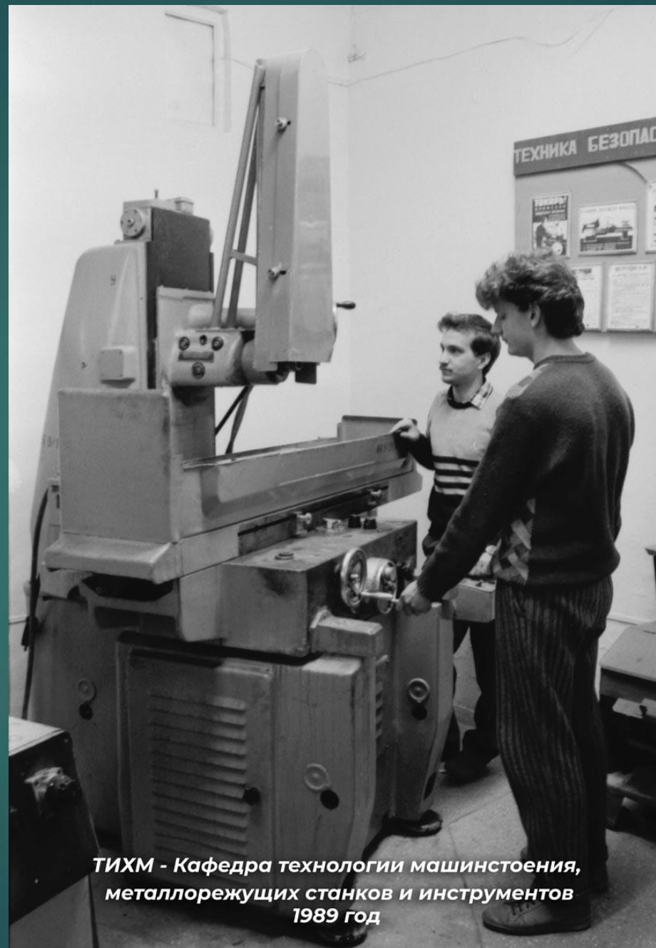
ТИХМ - Кафедра технологии машиностроения, металлорежущих станков и инструментов 1989 год