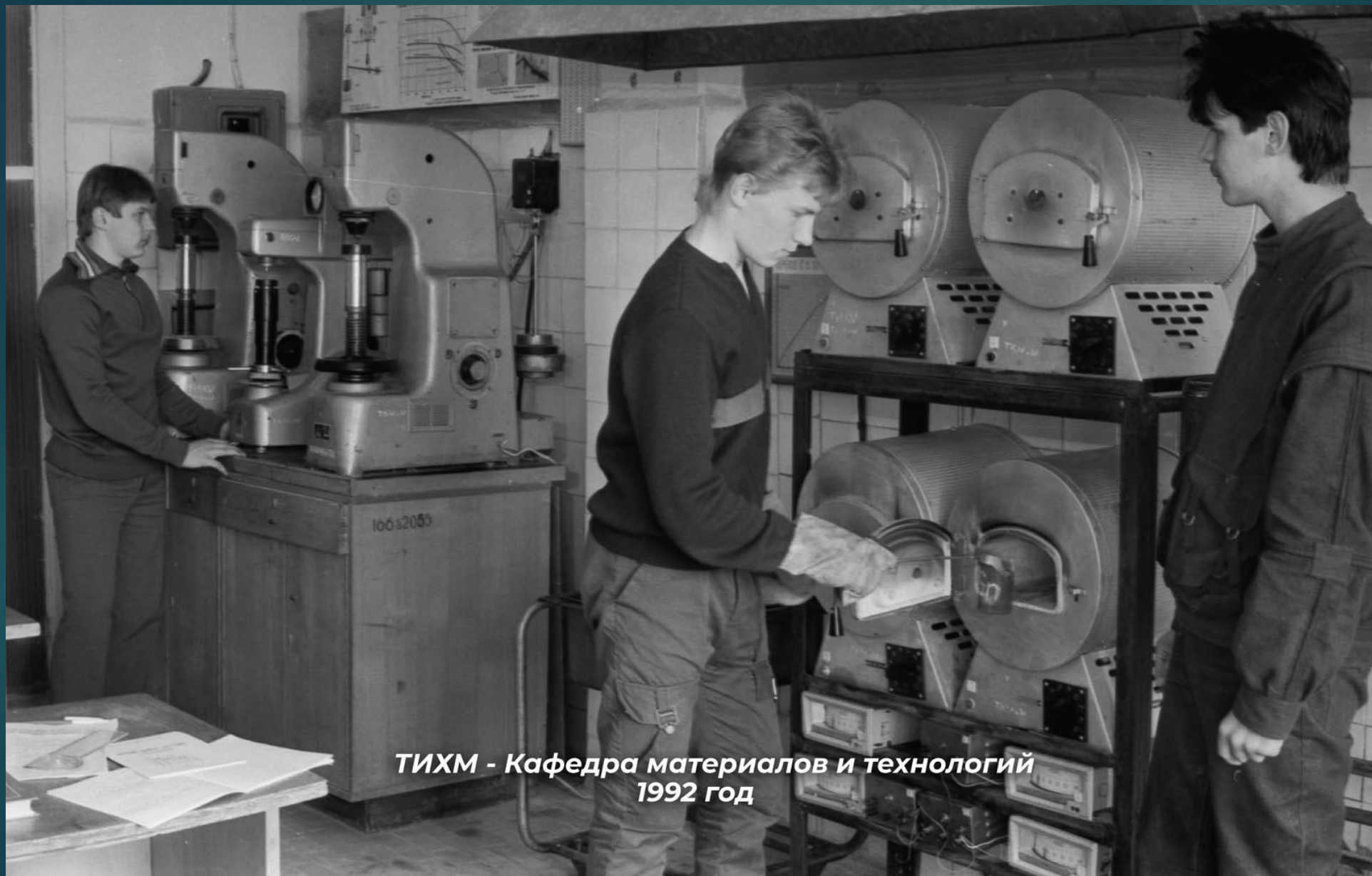
ТИХМ - Кафедра материалов и технологий 1992 год