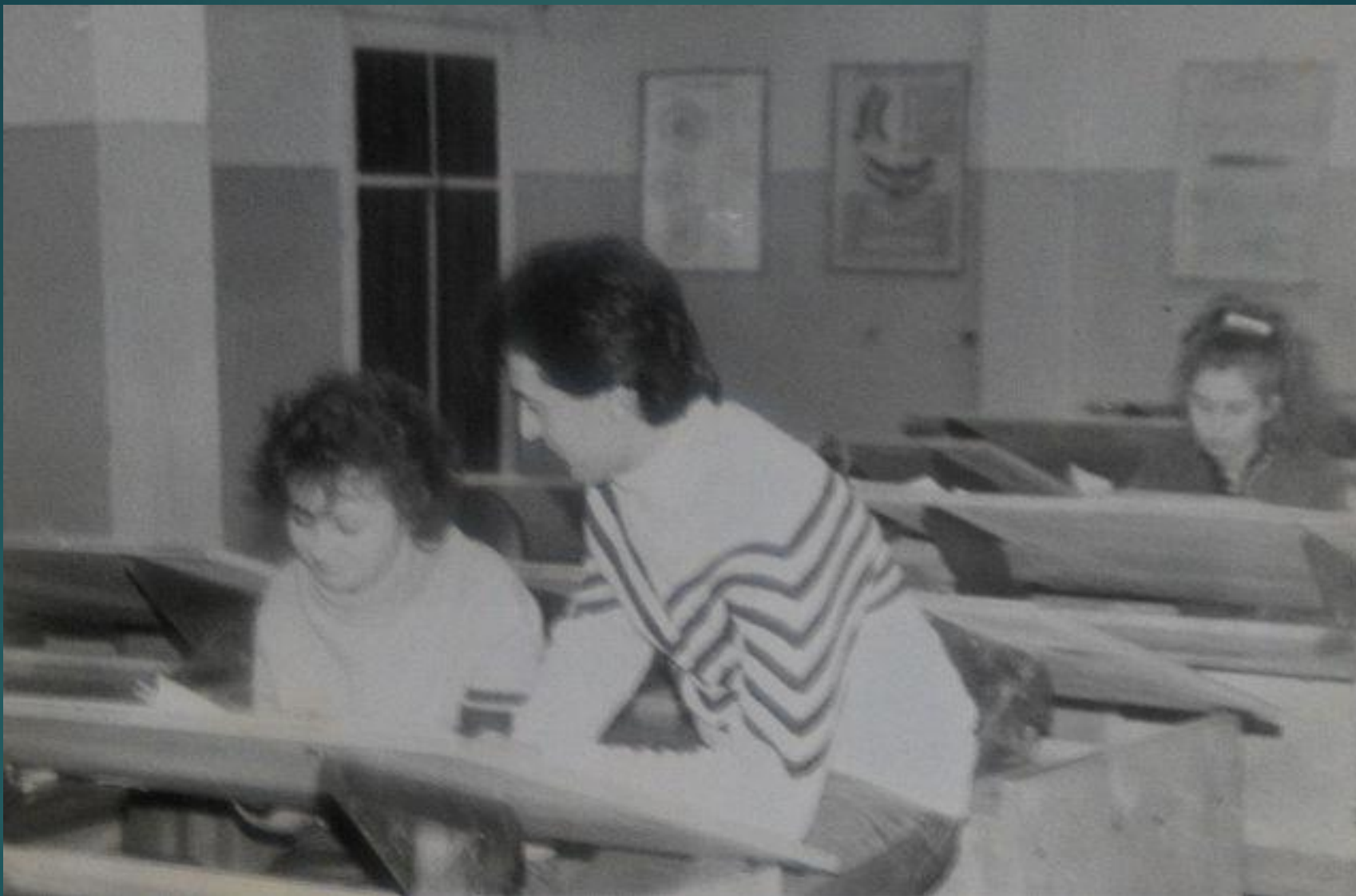
На кафедре черчения