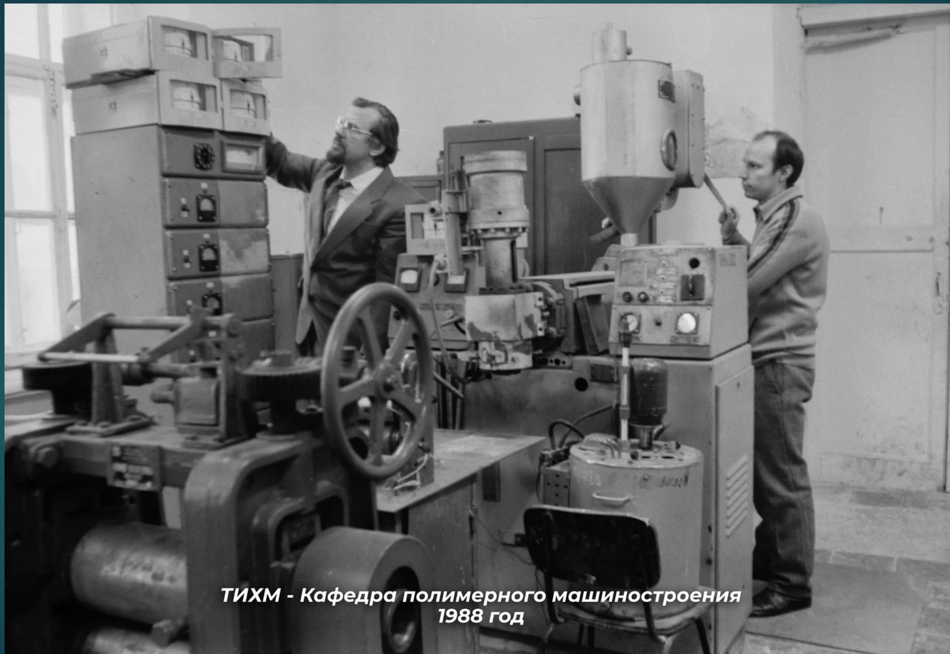
ТИХМ - Кафедра полимерного машиностроения 1988 год