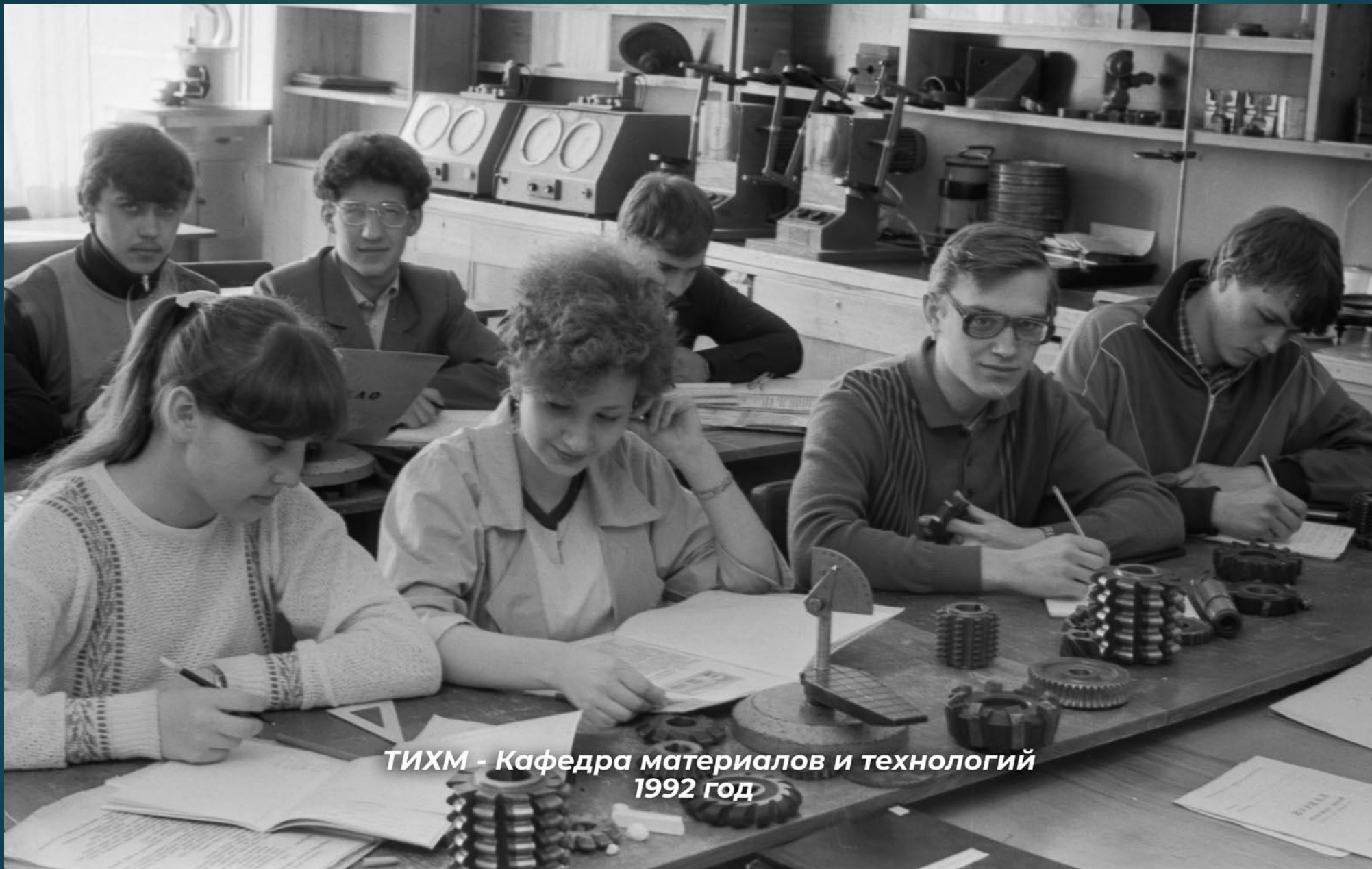
ТИХМ - Кафедра материалов и технологий 1992 год