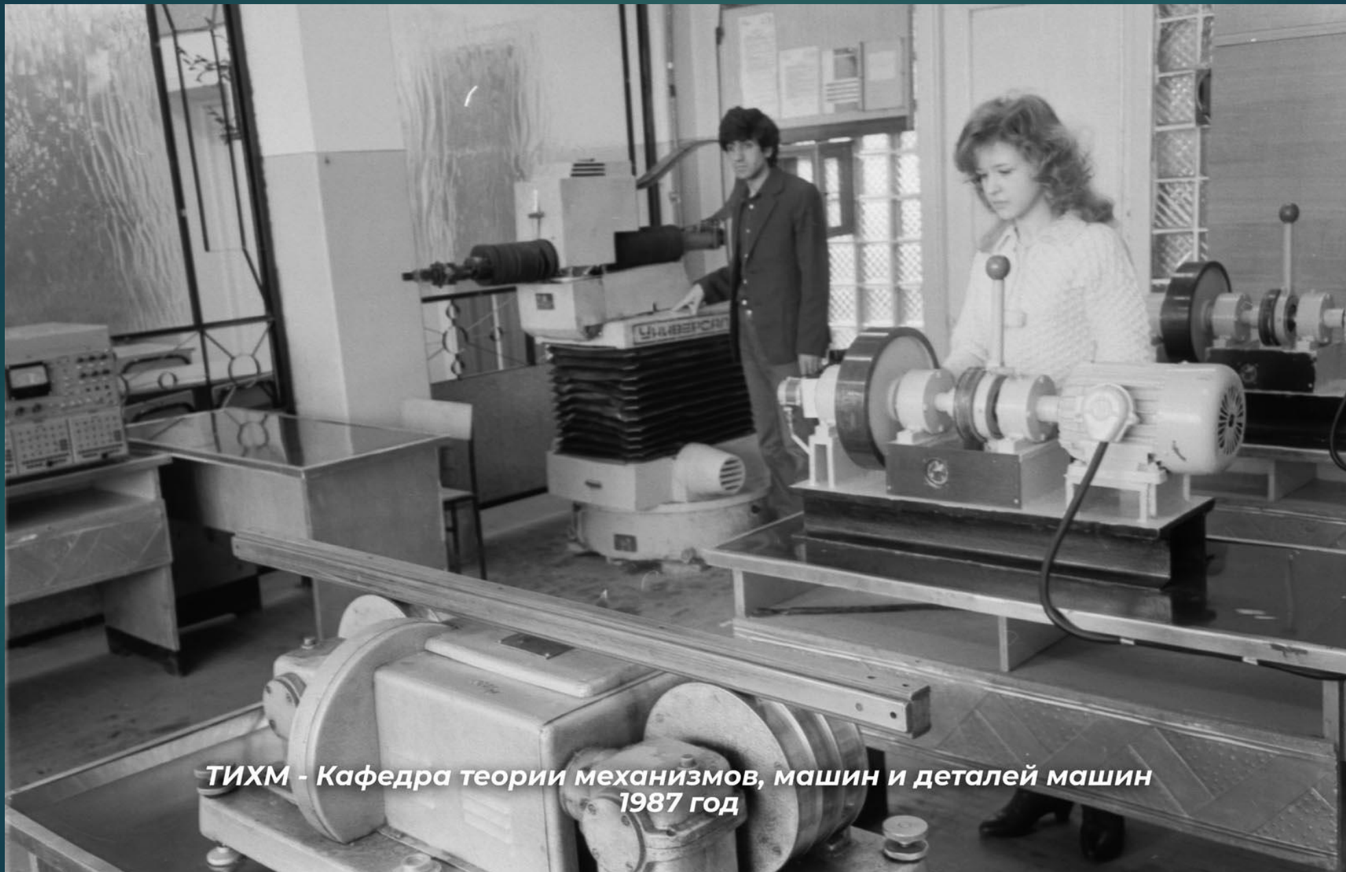
ТИХМ - Кафедра теории механизмов, машин и деталей машин 1987 год