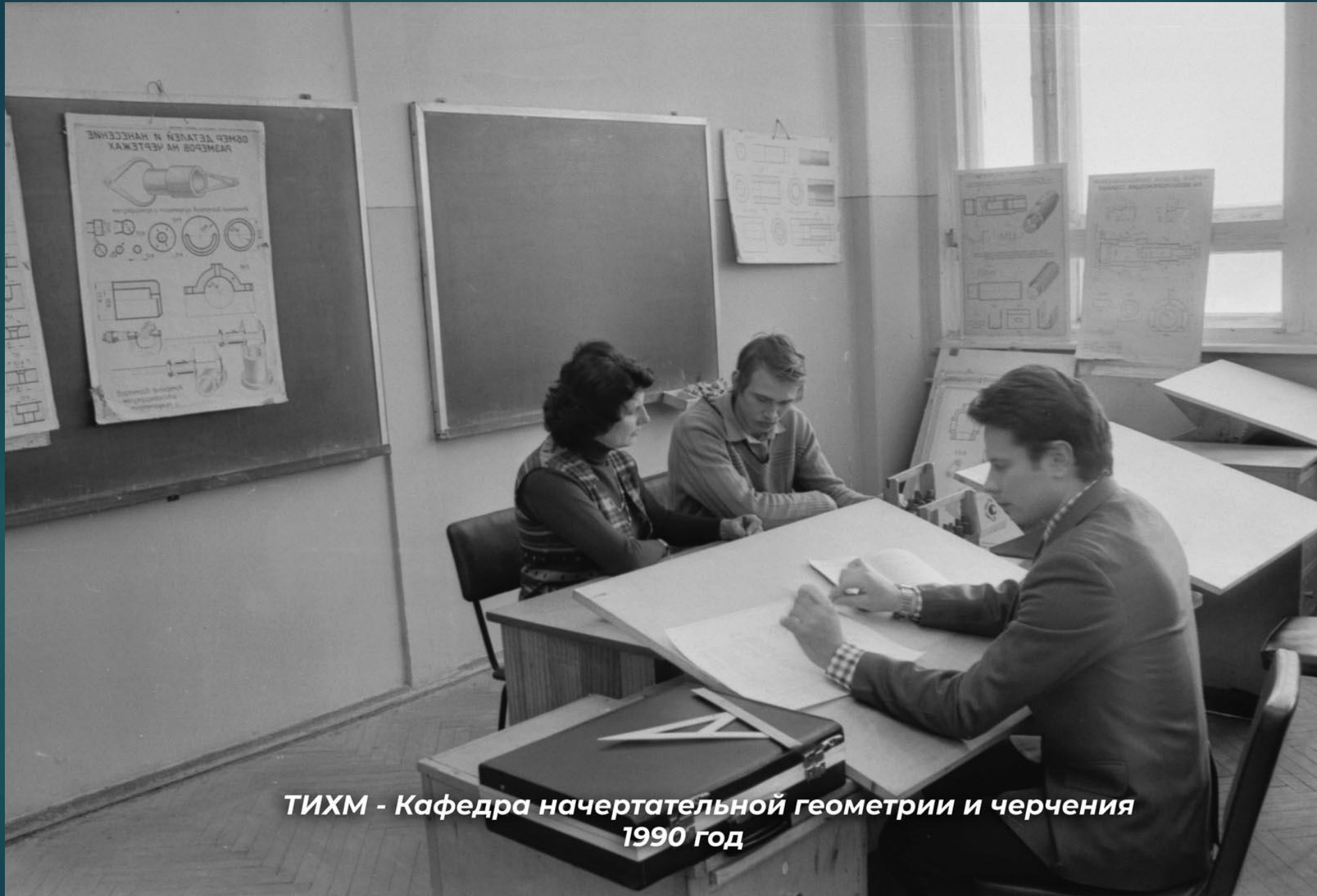
ТИХМ - Кафедра начертательной геометрии и черчения 1990 год