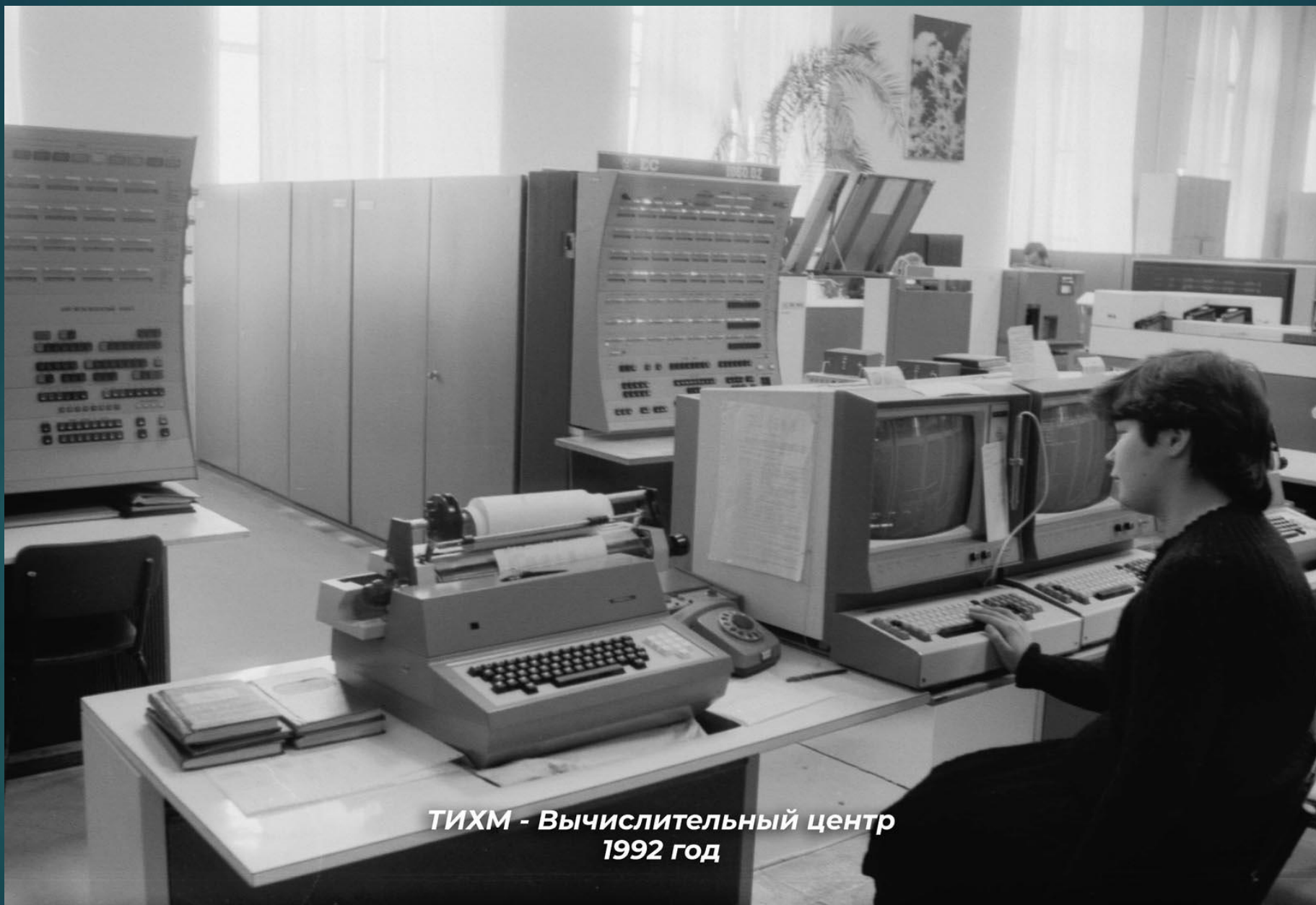
ТИХМ - Вычислительный центр 1992 год