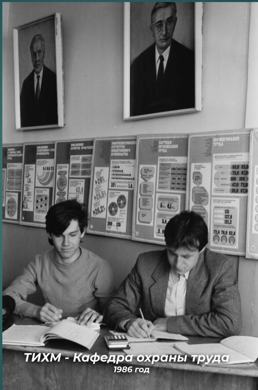
ТИХМ - Кафедра охраны труда 1986 год