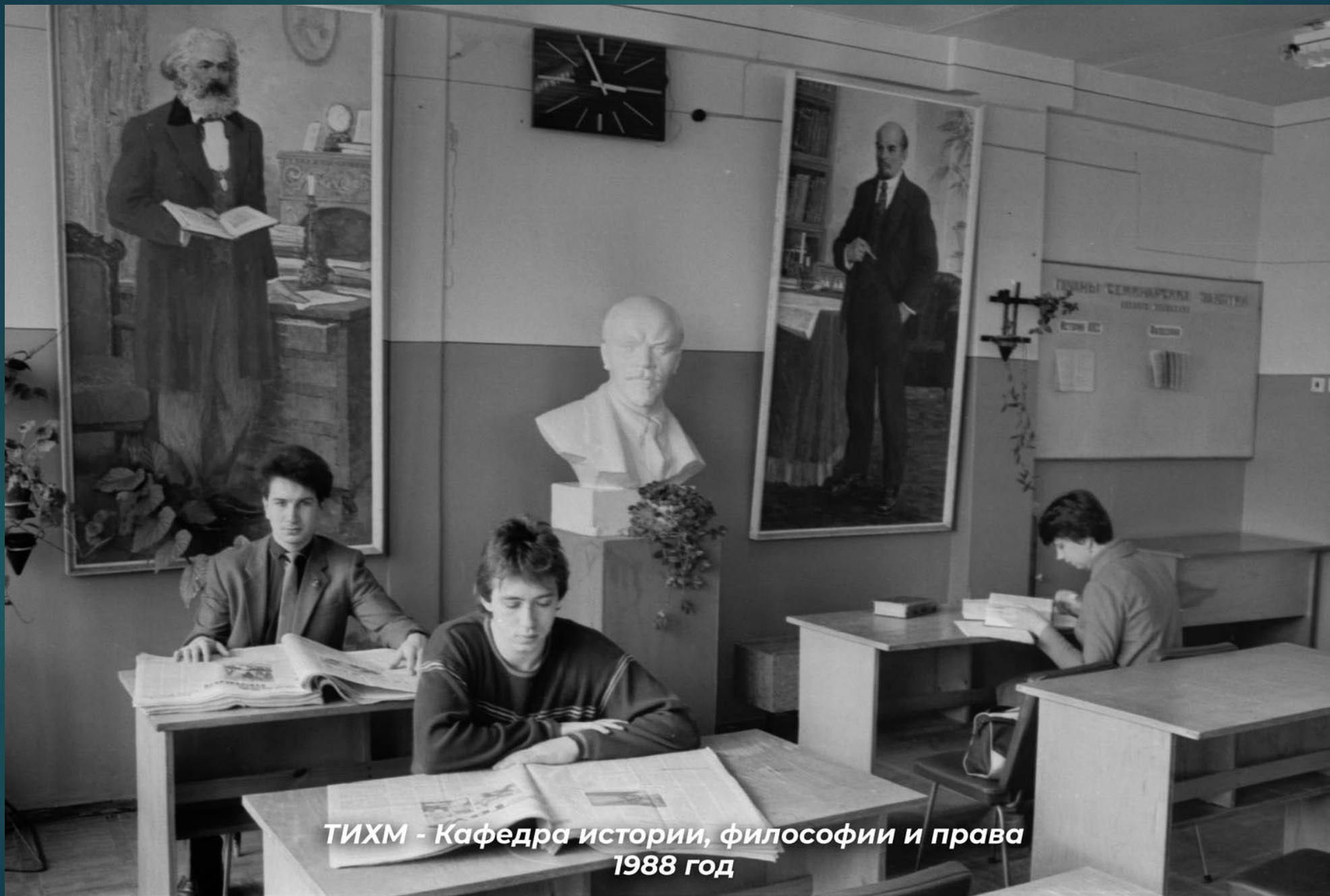
ТИХМ - Кафедра истории, философии и права 1988 год