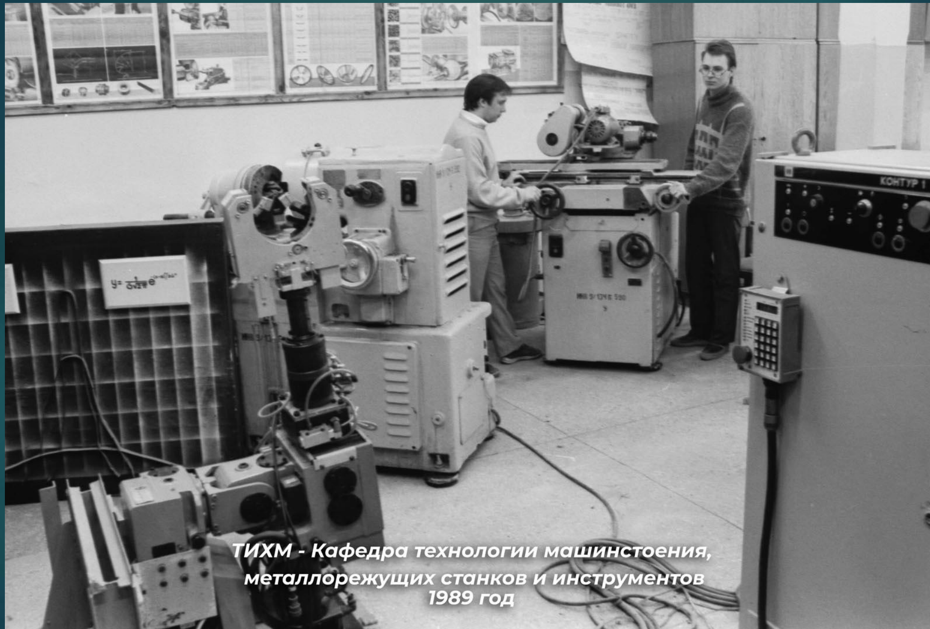
ТИХМ - Кафедра технологии машиностроения, металлорежущих станков и инструментов 1989 год