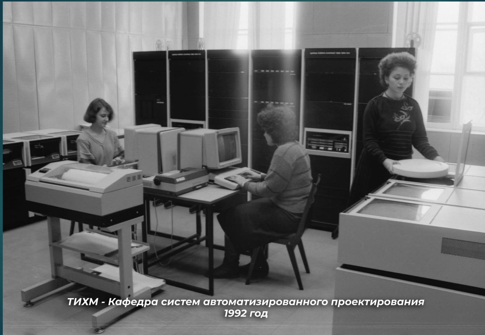
ТИХМ - Кафедра систем автоматизированного проектирования 1992 год