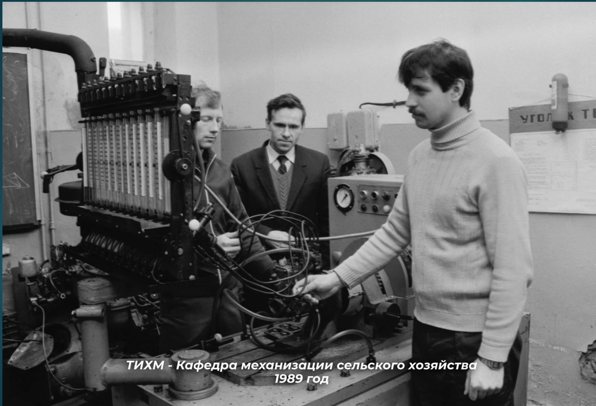
ТИХМ - Кафедра механизации сельского хозяйства 1989 год