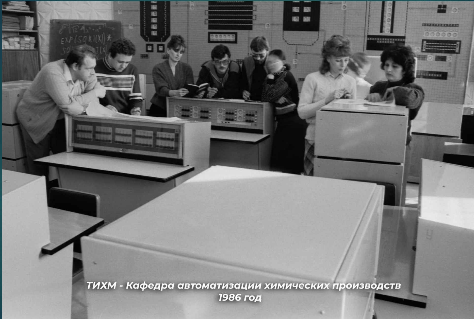
ТИХМ - Кафедра автоматизации химических производств 1986 год