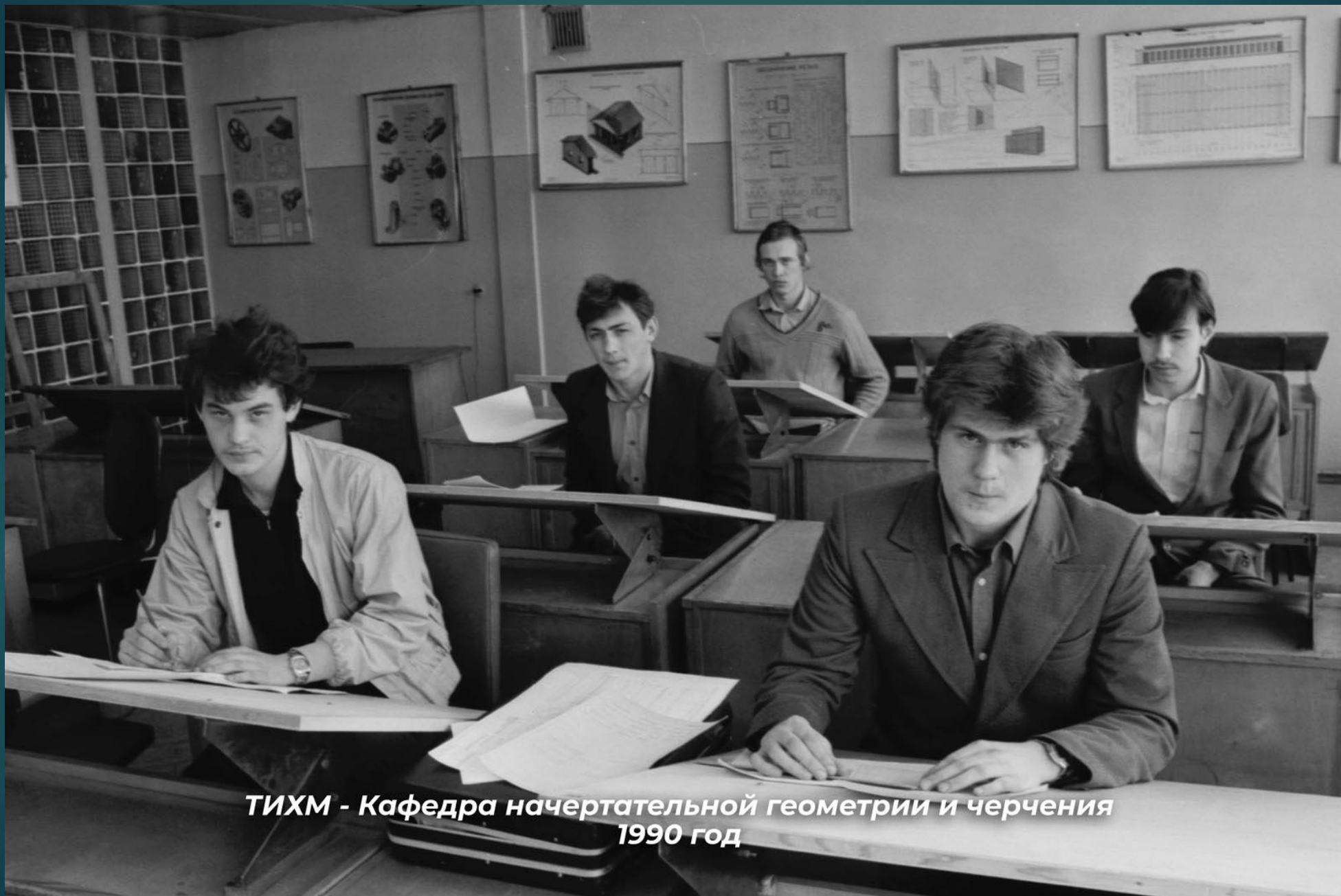
ТИХМ - Кафедра начертательной геометрии и черчения 1990 год