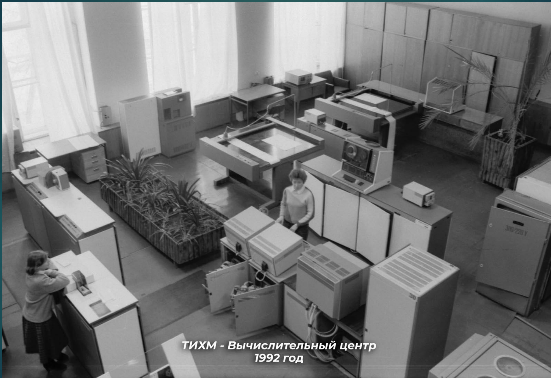
ТИХМ - Вычислительный центр 1992 год