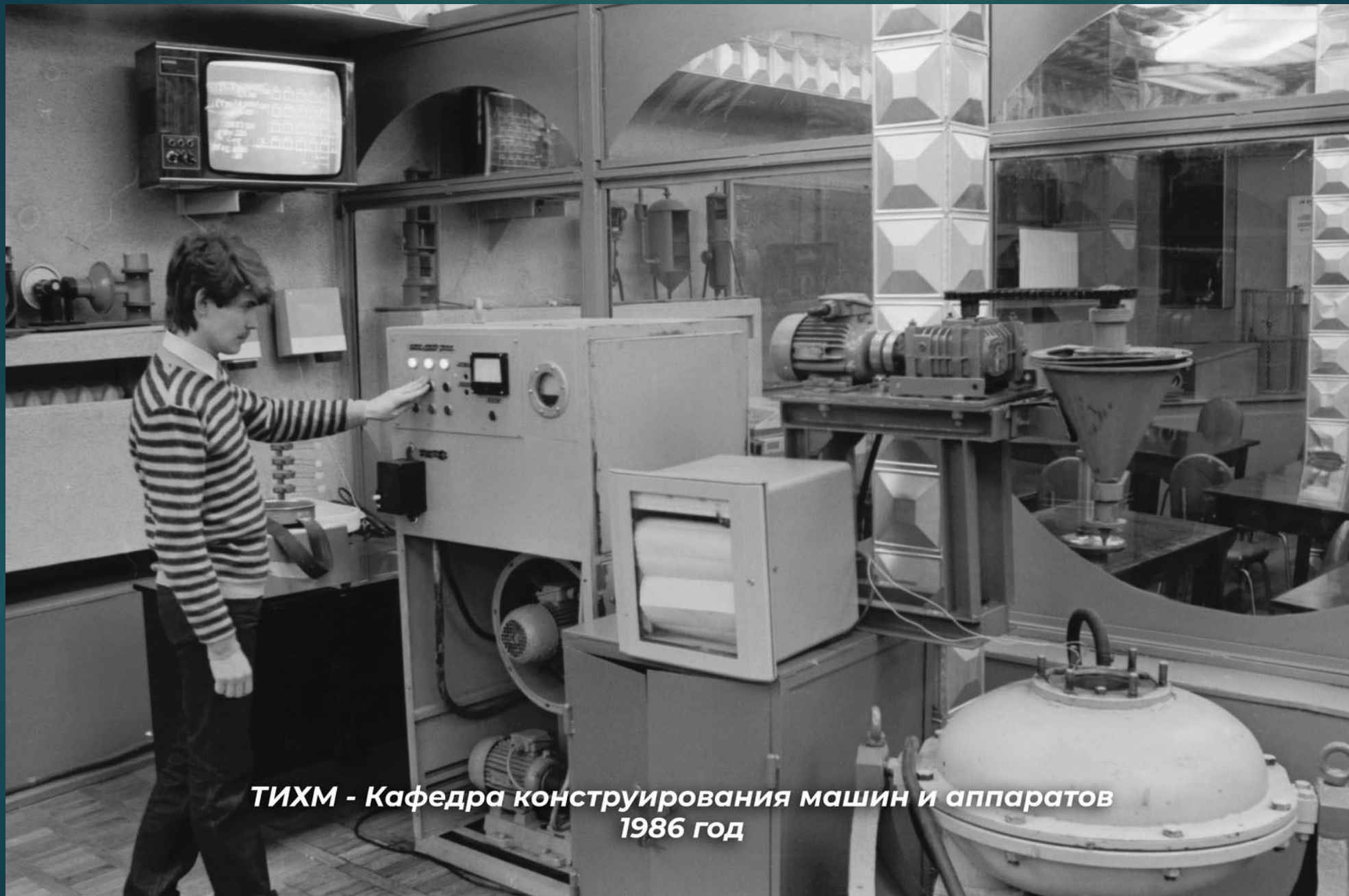
ТИХМ - Кафедра конструирования машин и аппаратов 1986 год