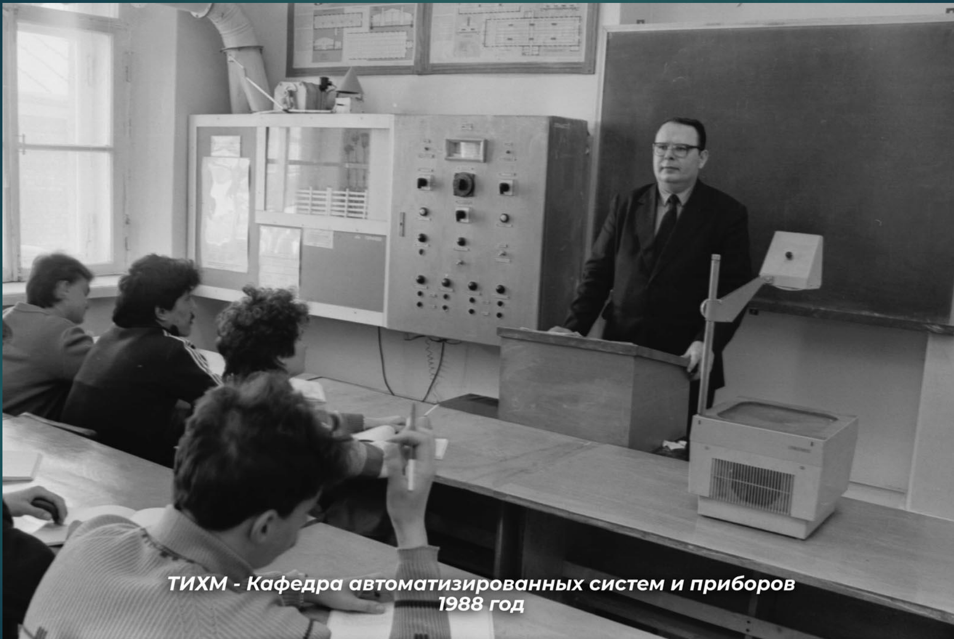
ТИХМ - Кафедра автоматизированных систем и приборов 1988 год