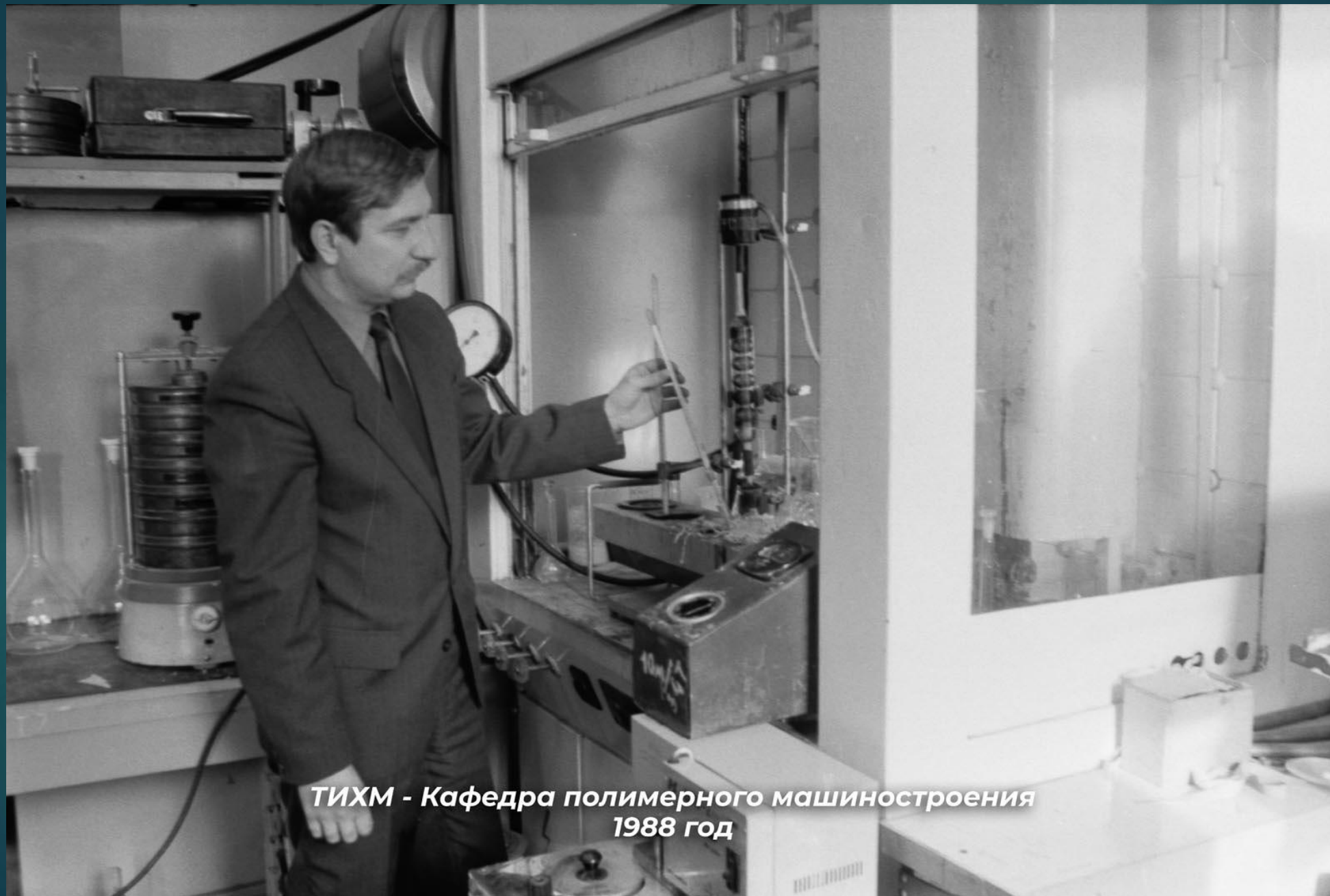
ТИХМ - Кафедра полимерного машиностроения 1988 год