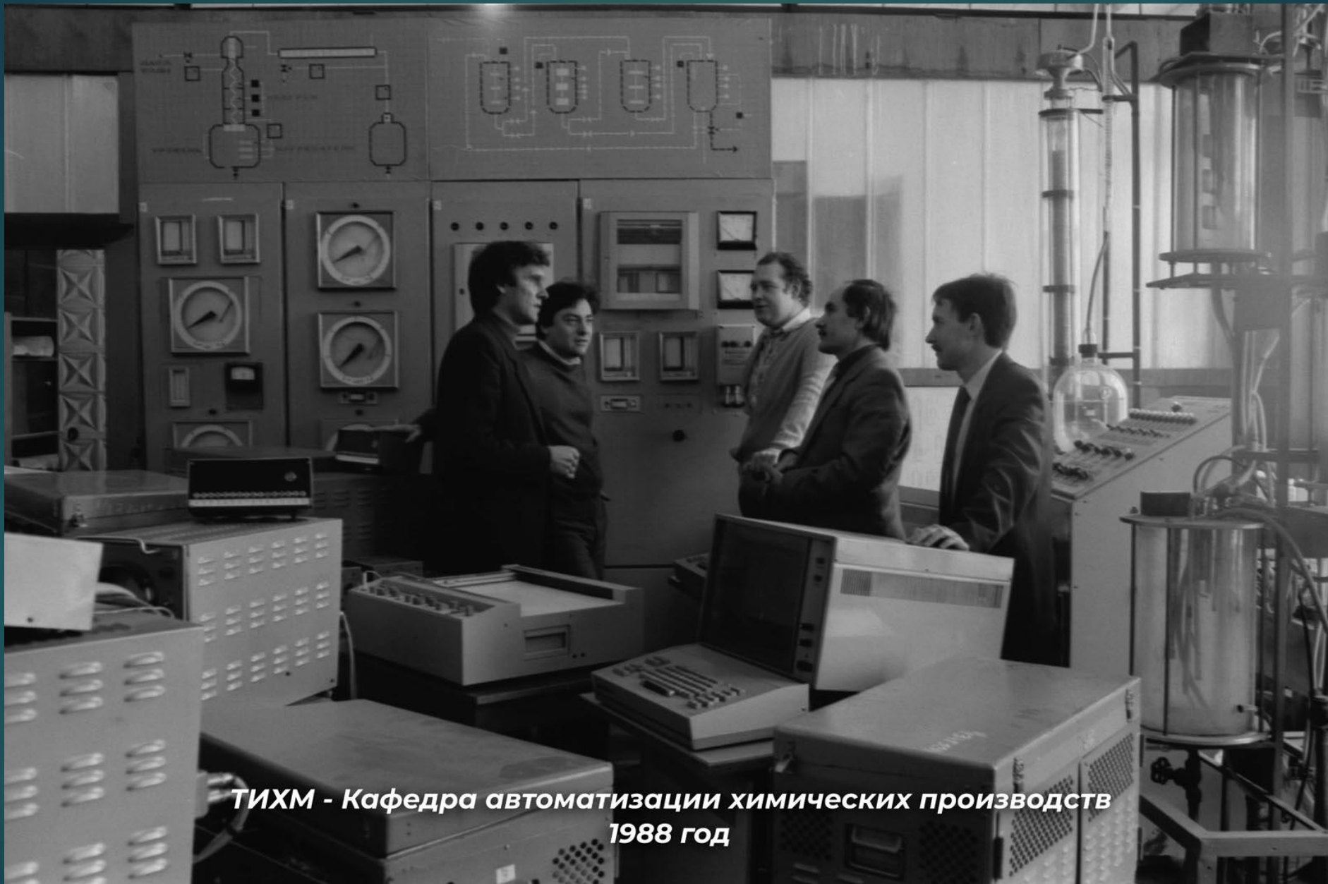
ТИХМ - Кафедра автоматизации химических производств 1988 год