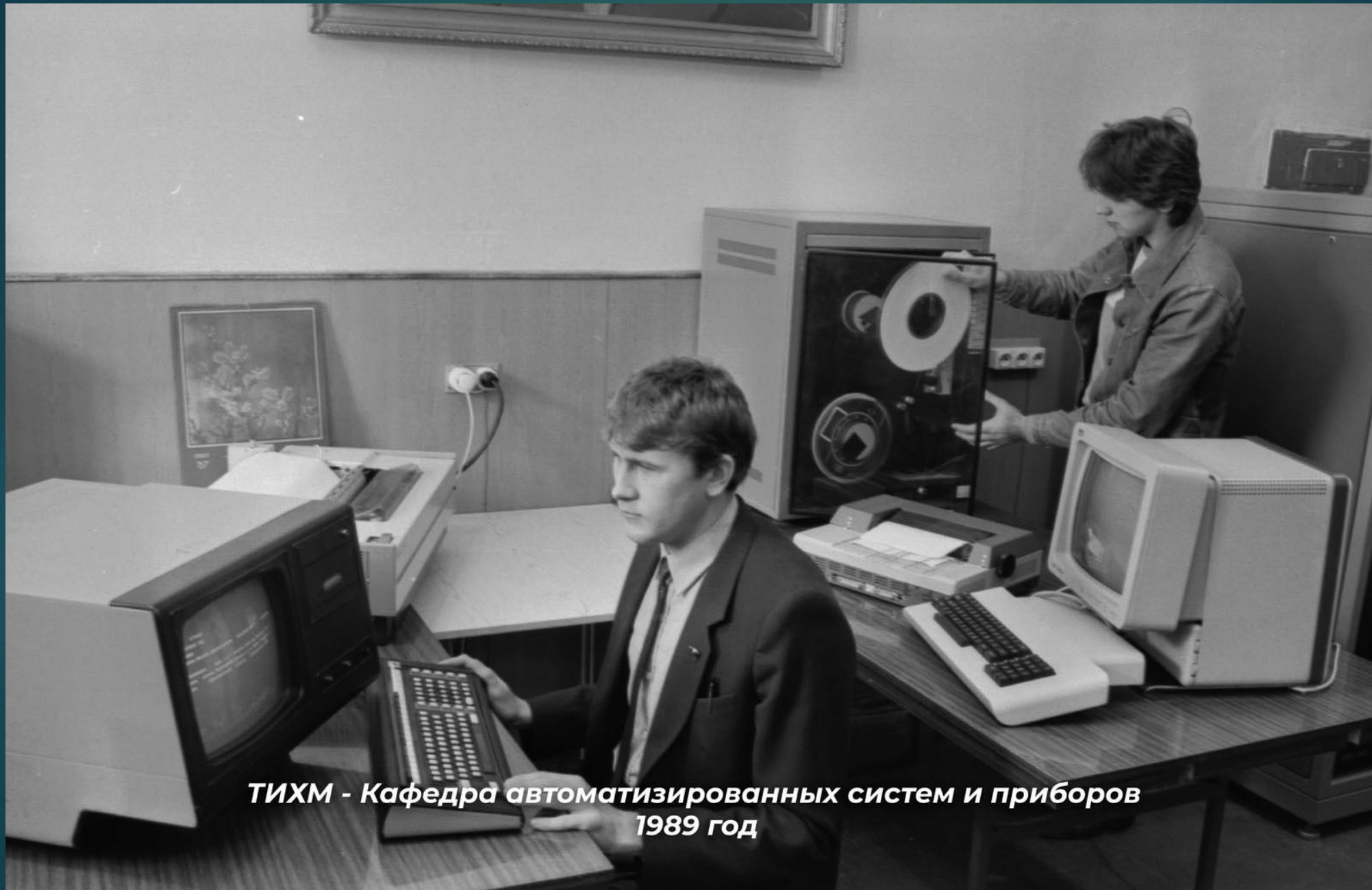
ТИХМ - Кафедра автоматизированных систем и приборов 1989 год