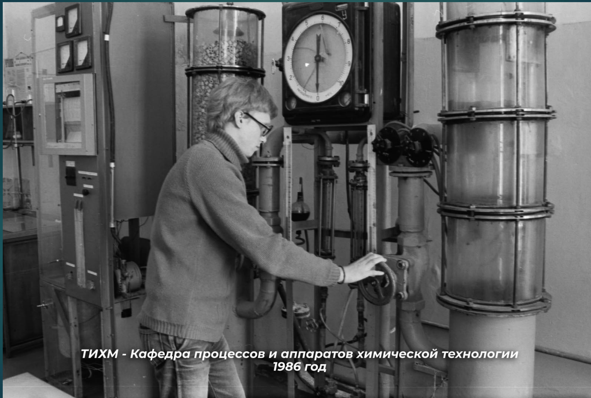
ТИХМ - Кафедра процессов и аппаратов химической технологии 1986 год