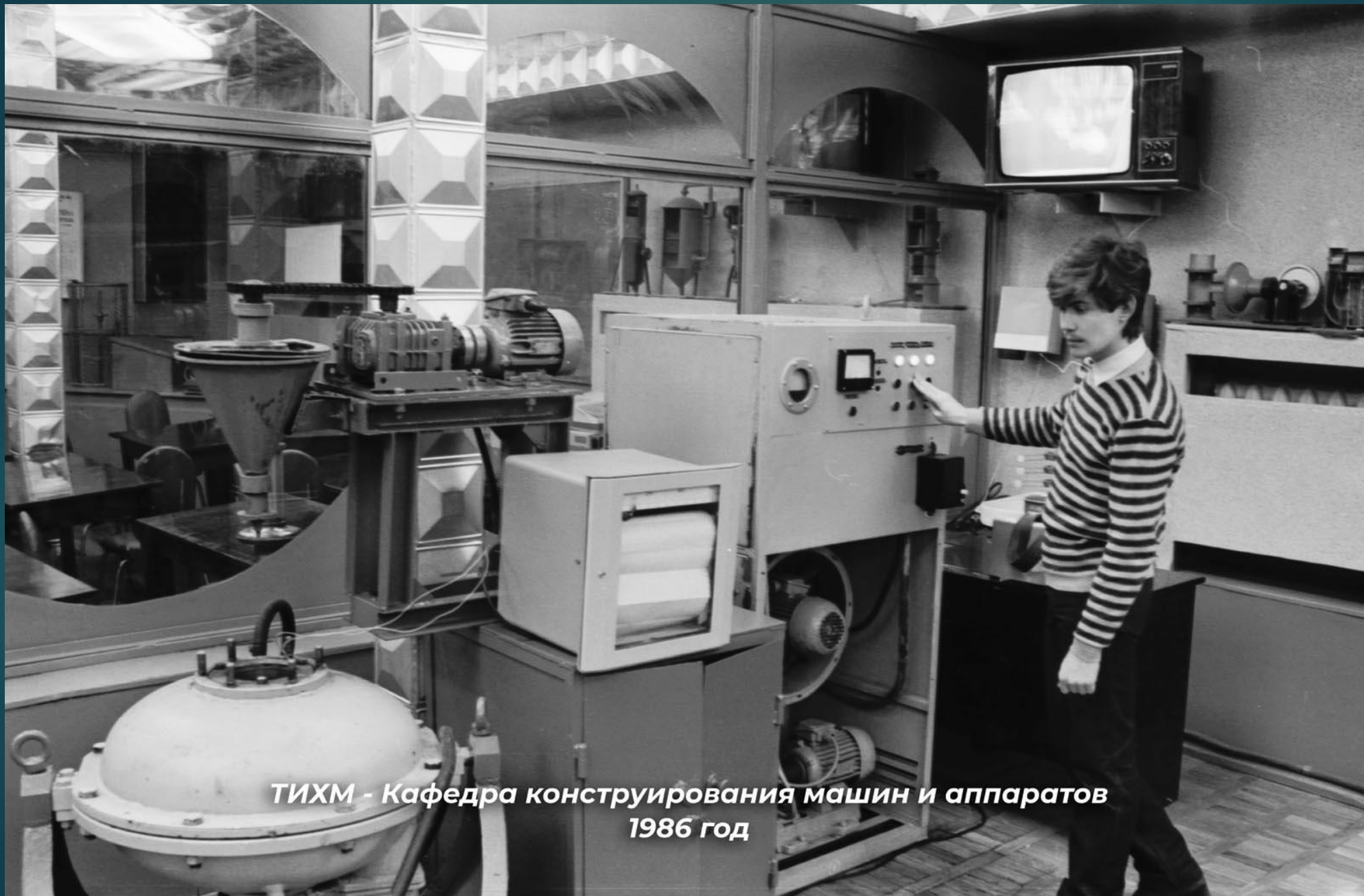
ТИХМ - Кафедра конструирования машин и аппаратов 1986 год