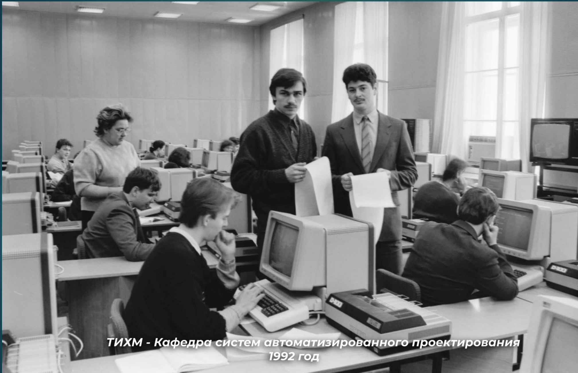
ТИХМ - Кафедра систем автоматизированного проектирования 1992 год