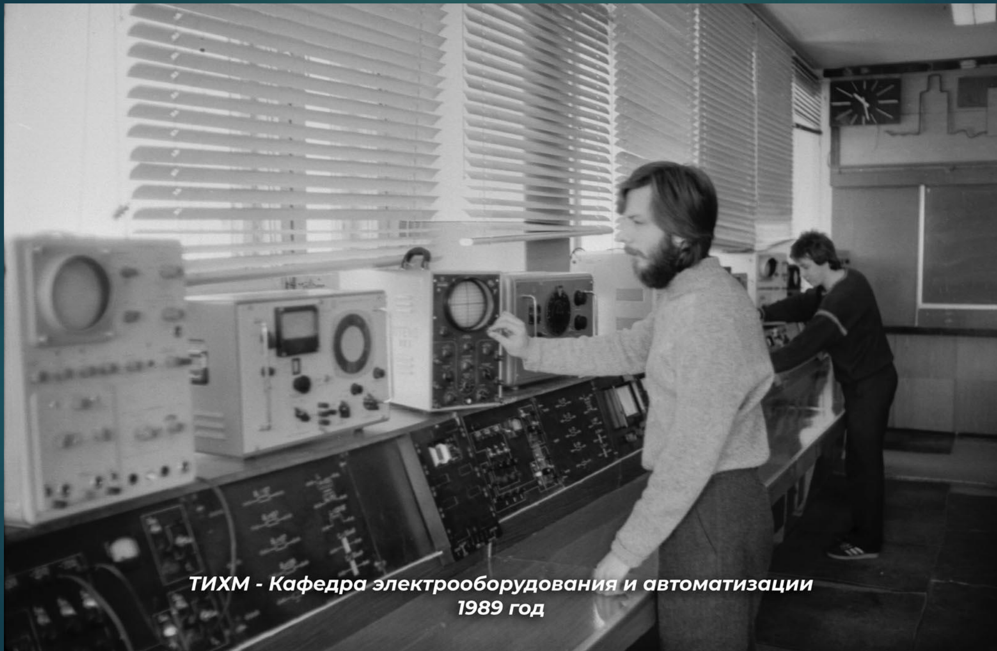
ТИХМ - Кафедра электрооборудования и автоматизации 1989 год