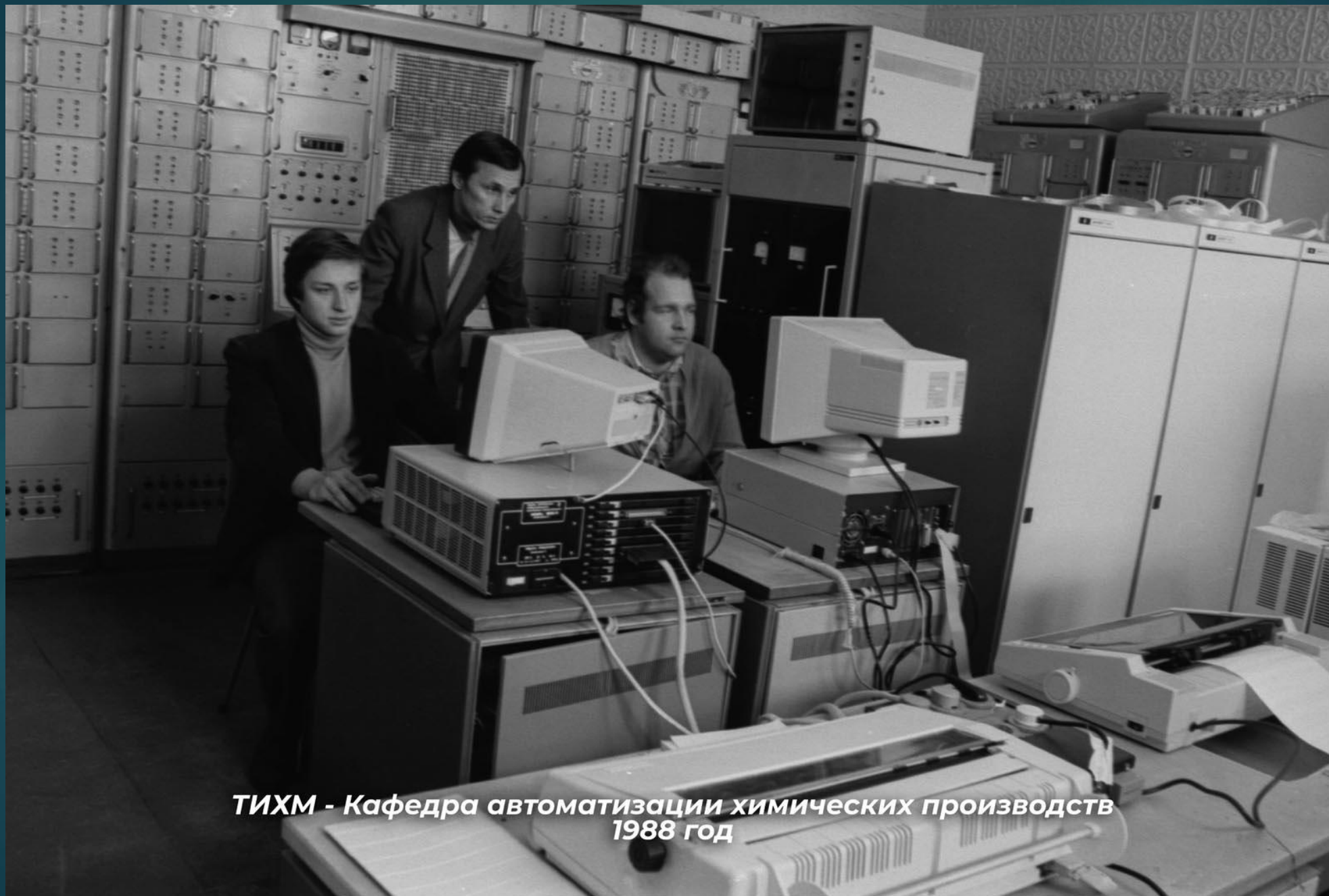
ТИХМ - Кафедра автоматизации химических производств 1988 год