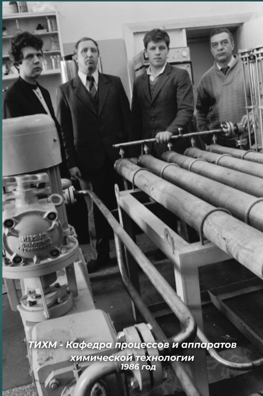
ТИХМ - Кафедра процессов и аппаратов химической технологии 1986 год