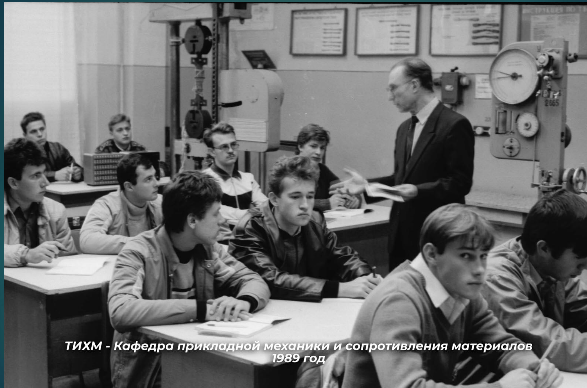
ТИХМ - Кафедра прикладной механики и сопротивления материалов 1989 год