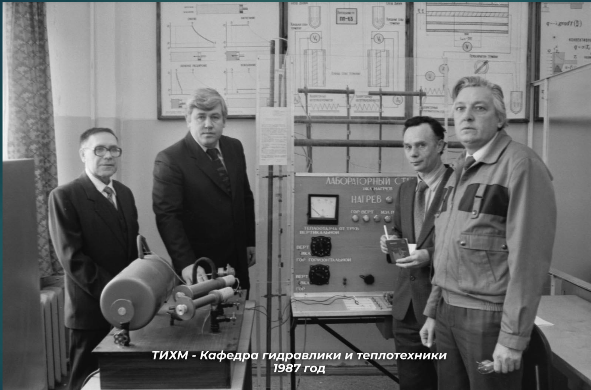
ТИХМ - Кафедра гидравлики и теплотехники 1987 год