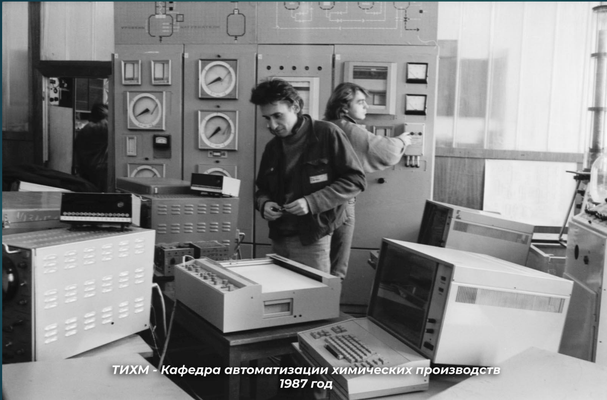
ТИХМ - Кафедра автоматизации химических производств 1987 год