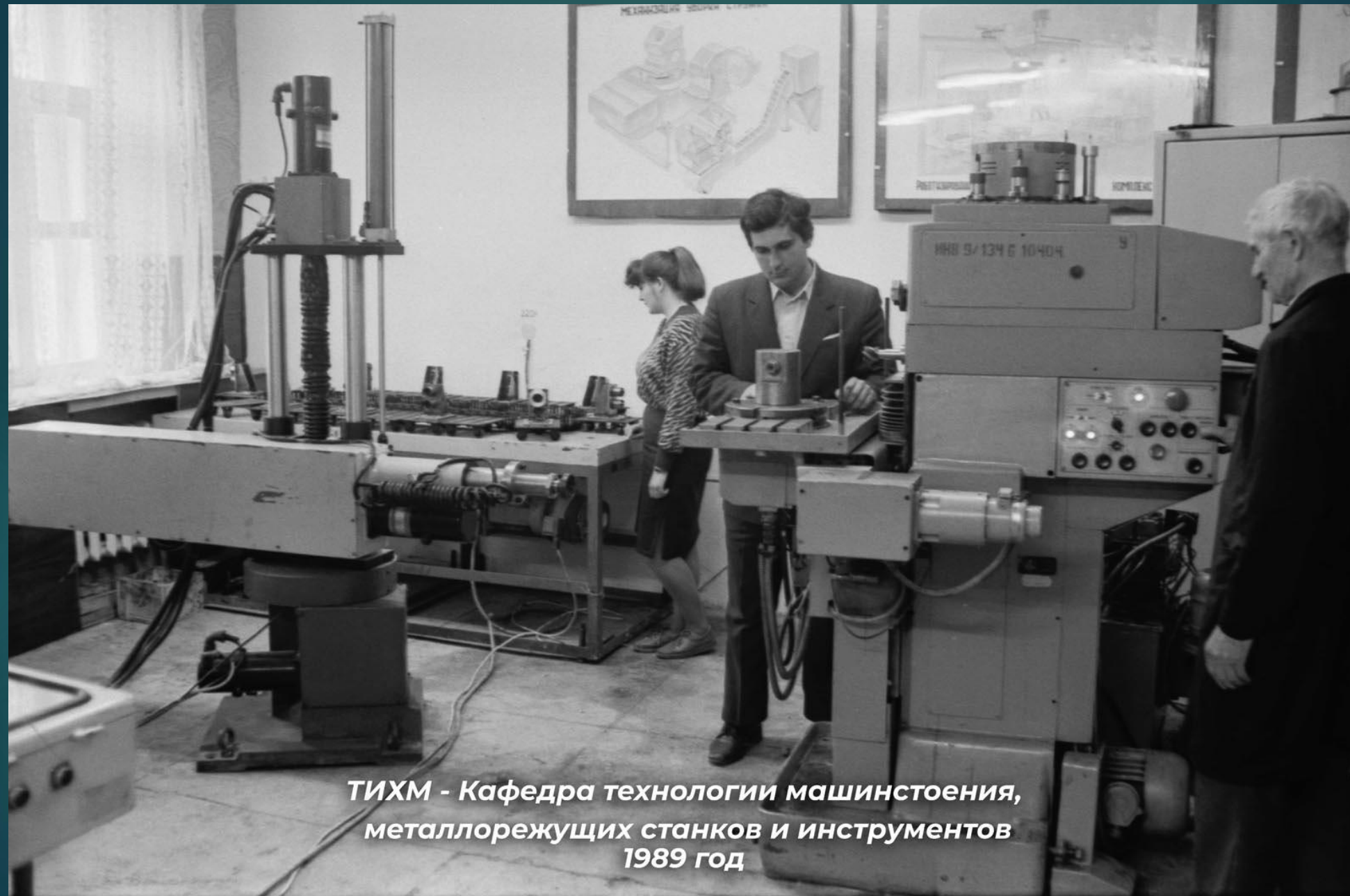
ТИХМ - Кафедра технологии машиностроения, металлорежущих станков и инструментов 1989 год