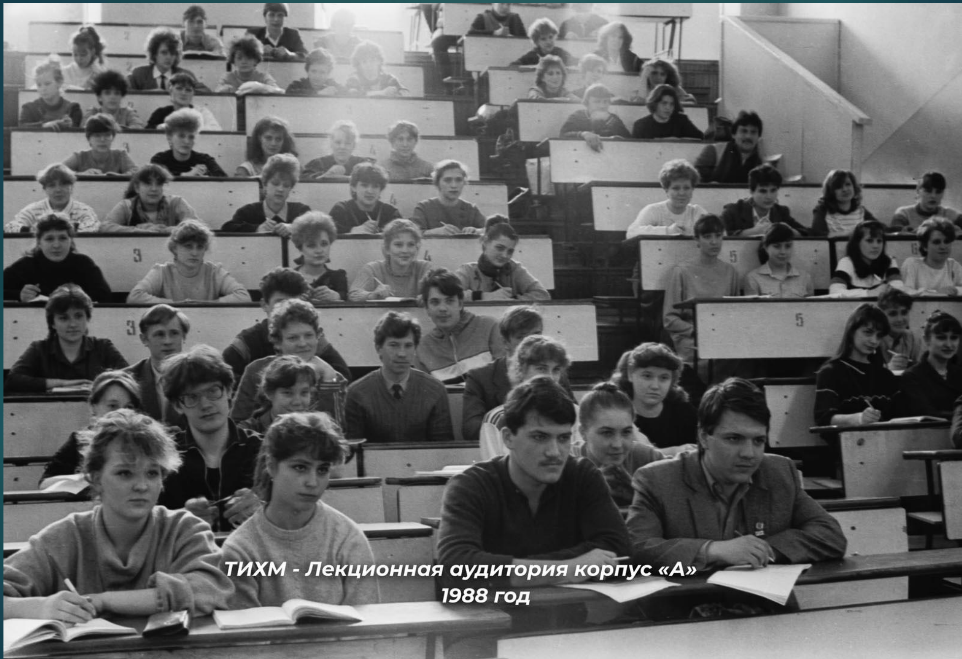
ТИХМ - Лекционная аудитория корпус «А» 1988 год