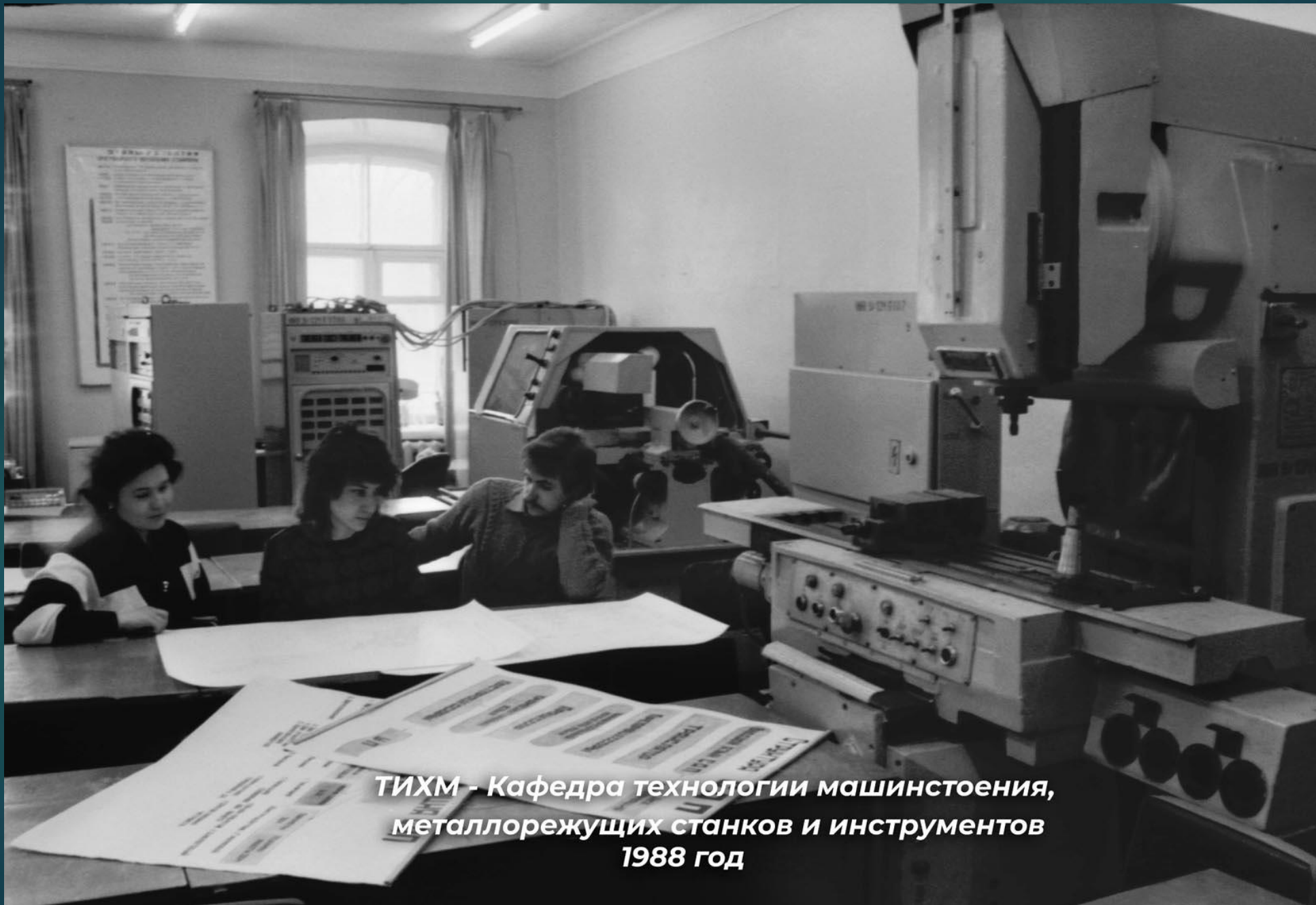
ТИХМ - Кафедра технологии машиностроения, металлорежущих станков и инструментов 1988 год