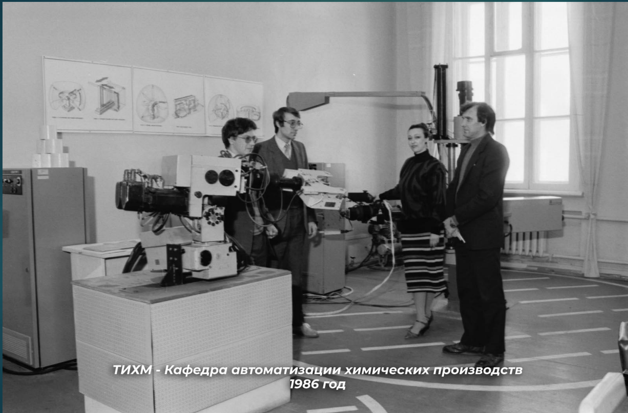
ТИХМ - Кафедра автоматизации химических производств 1986 год