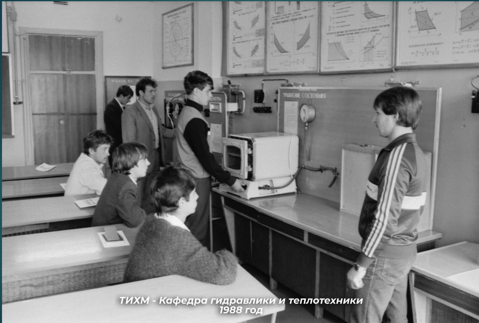
ТИХМ - Кафедра гидравлики и теплотехники 1988 год