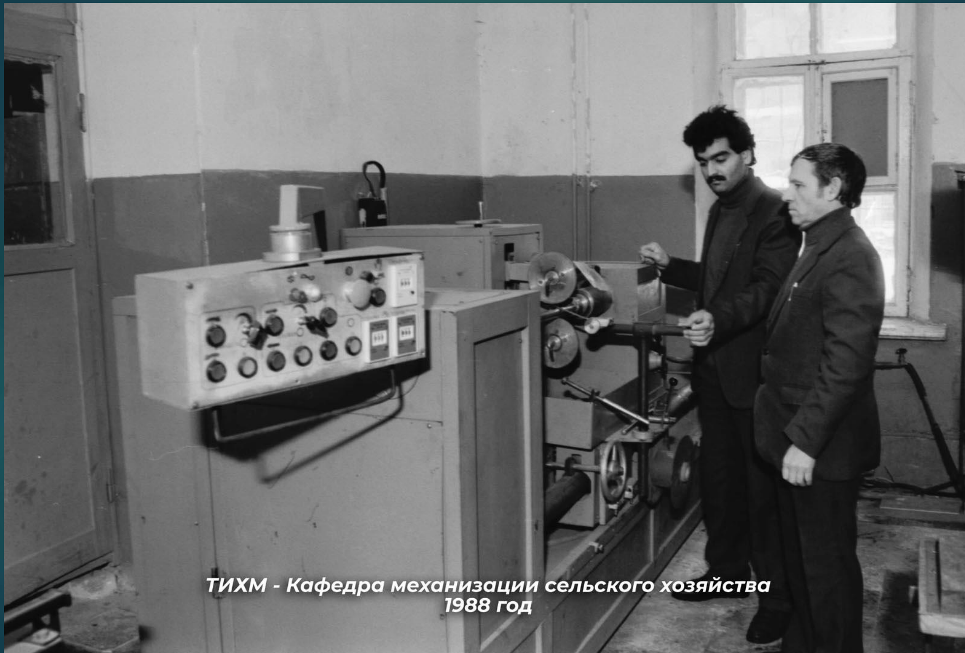
ТИХМ - Кафедра механизации сельского хозяйства 1988 год