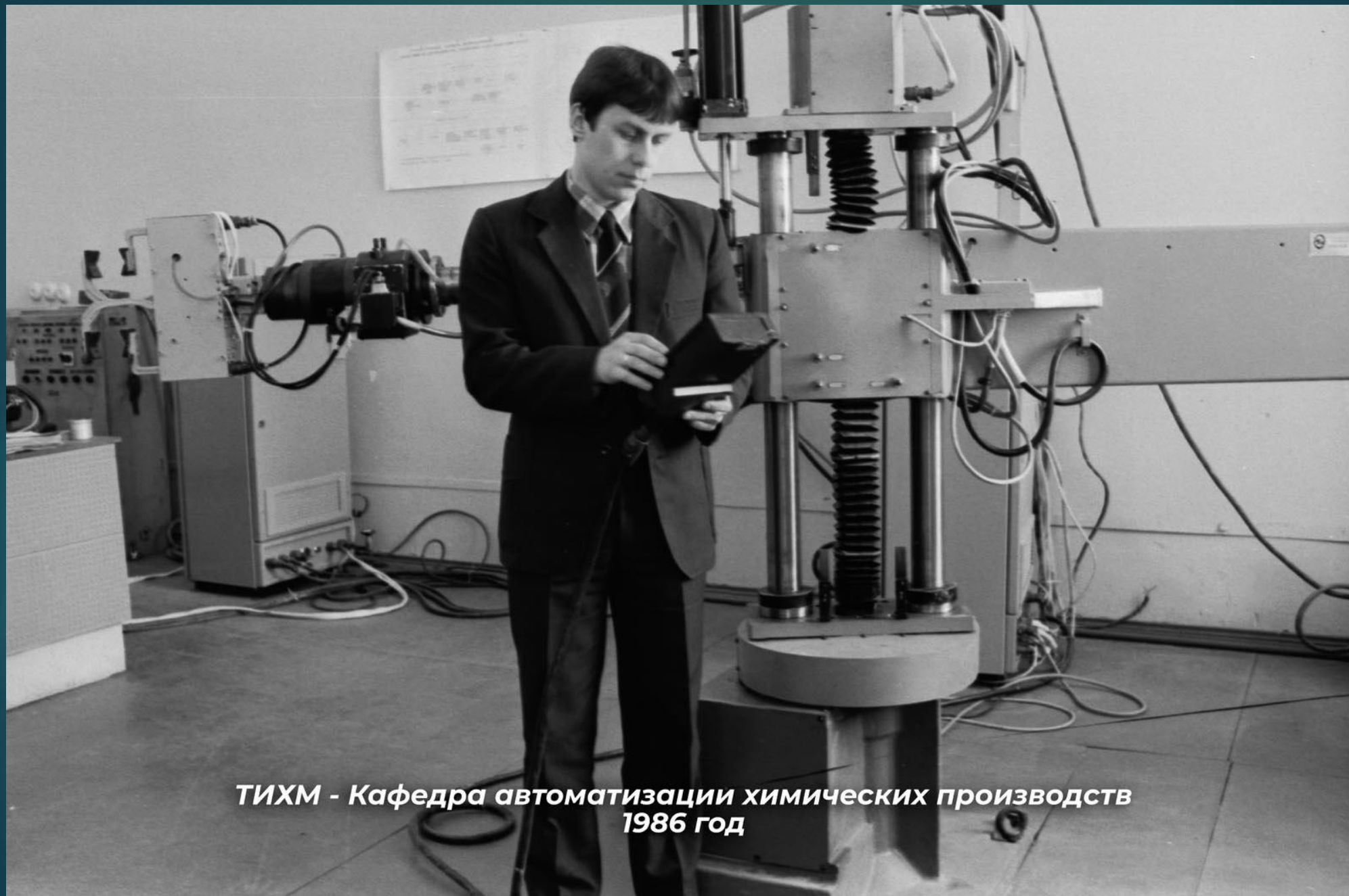
ТИХМ - Кафедра автоматизации химических производств 1986 год