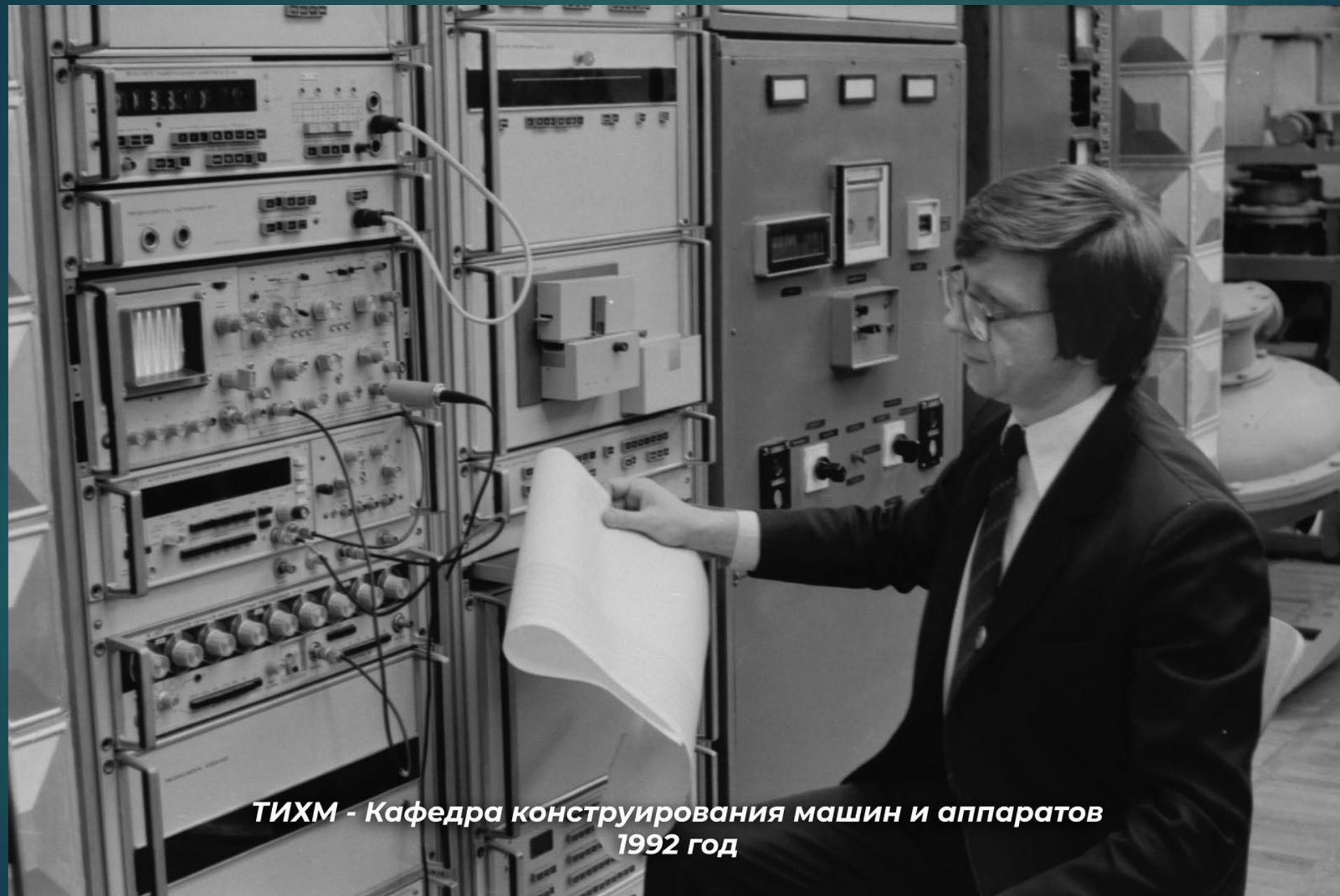
ТИХМ - Кафедра конструирования машин и аппаратов 1992 год