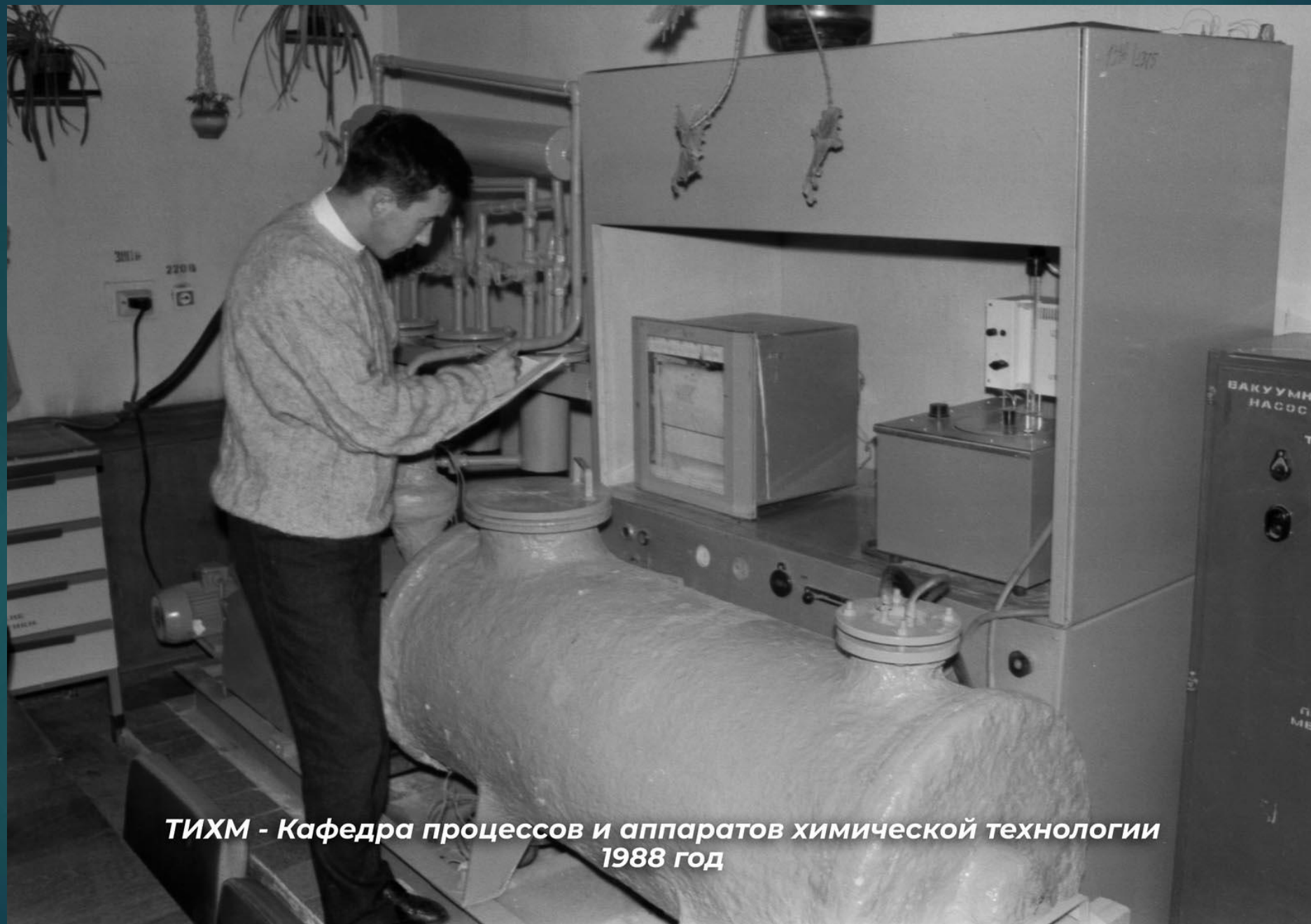
ТИХМ - Кафедра процессов и аппаратов химической технологии 1988 год